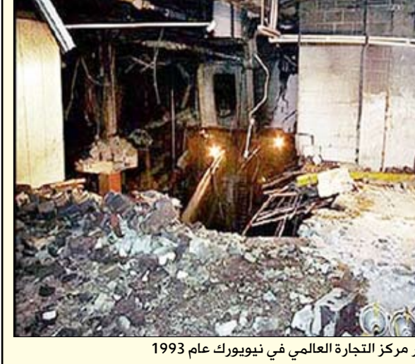
من آثار تفجير مركز التجارة العالمي في نيويورك عام 1993

سبأ / سبأ: أكدت وزيرة الخارجية الأمريكية هيلاري كليتون أن الشيخ عمر عبدالرحمن حصل على الإجراءات القانونية الصحيحة في محاكمته، وقالت "إن الأدلة واضحة جداً ومقنعة". ويجب ما ذكرته وكالة "أنباء الشرق الأوسط" قالت كليتون "لدينا كل الأسباب لدعم هذه العملية والحكم الذي صدر بحقه". وذلك في رد كليتون على سؤال خلال مقابلة مع شبكة "سي إن إن" الأمريكية خلال زيارتها لسويسرا، ووزعتها الخارجية الأمريكية في واشنطن الليلة الماضية، حول طلب الرئيس الدكتور محمد مرسي تسليم الشيخ عمر عبدالرحمن لمصر لأسباب إنسانية. من جانبه أكد القائم بأعمال المتحدث باسم رئاسة الجمهورية