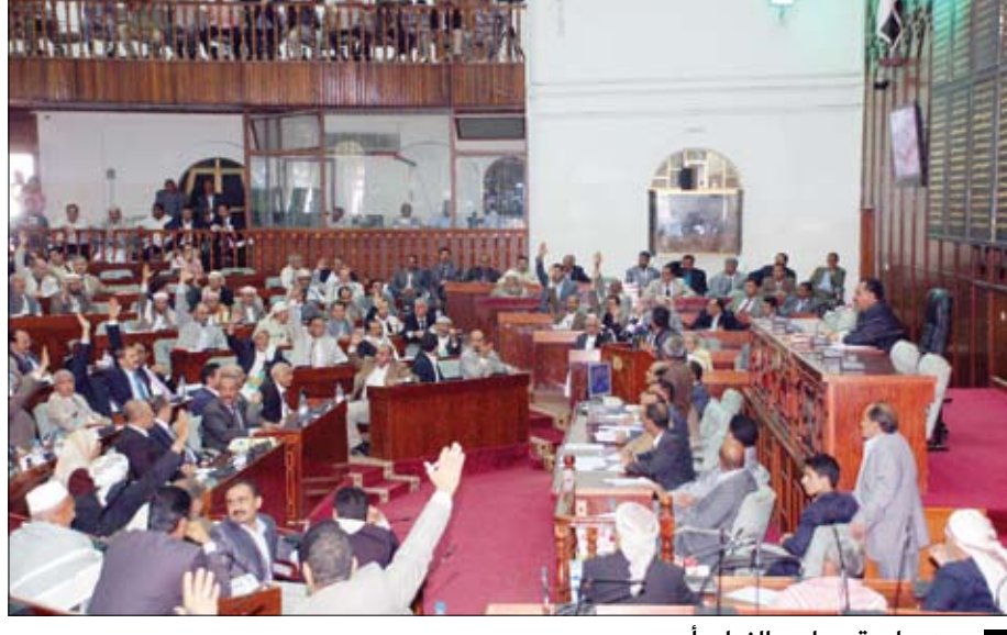
من جلسة مجلس النواب أمس

صنعاء / سبأ : وقف مجلس النواب في جلسته المنعقدة أمس برئاسة رئيس المجلس الأخ يحيى علي الراعي أمام موضوع رفع سعر مادة الديزل في ضوء تقرير اللجنة البرلمانية الخاصة المكلفة بدراسة موضوع رفع سعر الديزل بحضور رئيس حكومة الوفاق الوطني محمد سالم باسندوة وأعضاء الحكومة. وتم مناقشة هذا الموضوع باستفاضة وبمسئولية وطنية عالية . وفي هذا السياق رحب رئيس مجلس النواب برئيس وأعضاء الحكومة .. لافتاً إلى أن مجلس النواب يقف في هذا الموضوع والموضوعات الأخرى عوناً ومساعداً للحكومة في تنفيذ مهامها وبما يصب في مجرى خدمة الشعب اليمني وما تقتضيه مصلحة الوطنية العليا وأحداث تكامل بين مجلسي النواب والوزراء . فيما تحدث رئيس حكومة الوفاق الوطني الأخ محمد سالم باسندوة أن الحكومة حريصة على التوافق فيما بينها ومع مجلس النواب وبما يجعلها قادرة على مواجهة التحديات الكبيرة التي تقف أمام الجميع في المرحلة الراهنة. داعياً إلى أهمية توحيد الجهود لتنفيذ المهام بما ينسجم وبنود المبادرة الخليجية واليتها التنفيذية المزمعة . من جانبهم تحدث وزراء المالية والزراعة والثروة السمكية والنفط والمعادن موضحين لمجلس النواب الحثيثة التي أدت إلى اتخاذ الحكومة قرار الزيادة في سعر مادة الديزل والإجراءات المترتبة من قبل الحكومة في سبيل معالجة الآثار المترتبة على ذلك القرار ومكافحة عملية التهريب .