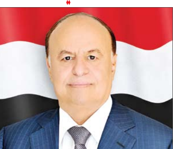
صنعاء / سبأ :