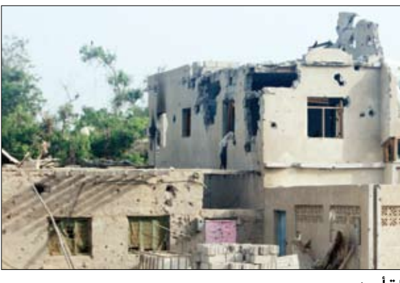
جانب من الدمار في محافظة أبين

مختلف صور الإرهاب والقتل والتشريد بحق أبناء المحافظة بجهة ميراث وأهمية منزوعة من أي قيم دينية أو أخلاقية . وأوضح المحافظ خلال اللقاء الذي عقد أمس بمدينة زنجبار وضم قادة الأحزاب والتنظيمات الكبير ضد عصابات القاعدة الإرهابية التي ارتكبت