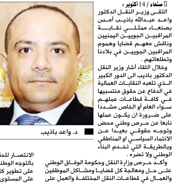
د. واعد باذيب

تحسين أوضاعهم المعيشية منوهاً بالأوضاع الاستثنائية التي يمر بها اليمن خلال هذه الفترة .. داعياً الجميع إلى بذل الجهود بهدف تحقيق النجاحات الملموسة التي تعكس على الوطن بالفائدة. وفي اللقاء استعرض الوزير باذيب العديد من المهموم والمشاكل العمالية التي عمدت الوزارة على حلها منذ مطلع العام الحالي، مجدداً دعمه لكافة حقوق العمال وتطلعاتهم والعمل على تحقيقها بكل السبل والإمكانات المتاحة . من جانبهم أشاد ممثلو نقابة المراقبين الجويين اليمنيين بالجهود التي تبذلها وزارة النقل خلال الفترة الماضية في الانتصار للحقوق العمالية والوقوف إلى جانبها وكذا بالتوجه الوطني لقيادتها في محاربة الفساد والعمل على تطوير كافة قطاعات النقل وفتح آفاق جديدة لها على المستوى المحلي والإقليمي والدولي .