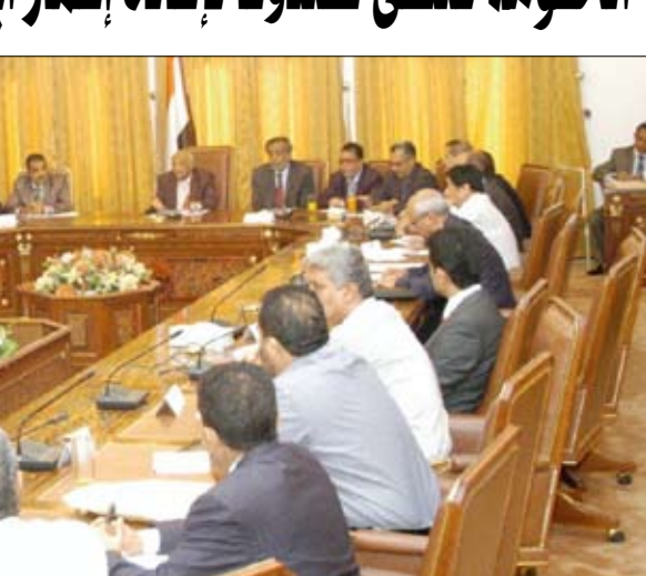
مجلس الوزراء أثناء اجتماعه أمس بعن

□ عدن / سبأ: أقر مجلس الوزراء إنشاء صندوق لإعادة الأعمار بمحاظفة أبين بمساهمة حكومية مبدئية قدرها 10 مليارات ريال، إلى جانب القسط المخصص من رواتب كافة موظفي الدولة ليوم واحد فقط، إضافة إلى ما ستقدمه الدول والمنظمات المانحة وشركاء اليمن في مكافحة الإرهاب من دعم للصندوق وتبرعات الخيرين ورجال الأعمال، وذلك للتسريع بخطوات إعادة الإعمار والاستفادة من تجارب الصناديق