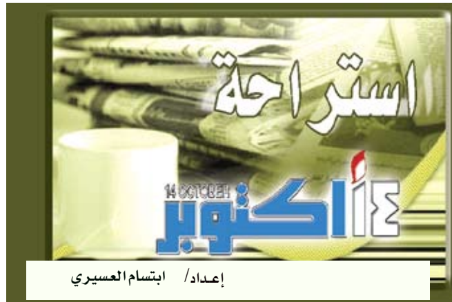
إعداد/ ابتسام العسيري

الوجه. وتن/ / مباحثات: كشفت دراسة حديثة أن الجانب الأيسر من الوجه هو الأكثر جاذبية من الأيمن، وهو ما يتسم مع ملاحظات النقاد عن تركيز الرسامين على تصوير الجانب الأيسر من الوجه في لوحاتهم. وأظهرت الدراسة التي نشرت في مجلة Exper-Mental Brain Research، أن الجانب الأيسر من وجه الإنسان أكثر سحرًا من الناحية الجمالية مقارنة بالجانب الأيمن. ويعتقد باحثو جامعة "فورست" الأميركية أن السبب وراء ذلك يكمن في أن عضلات الجانب الأيسر تمتلك قدرة أكبر على خلق تعابير وجهية أكثر شدة وعاطفية من الجانب الأيمن.