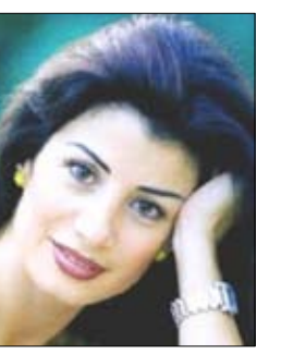
الشاعرة جمانة حداد