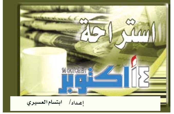
إعداد / ابتسام العسيري

ويهدد المرض ربع ضحاياه بمضاعفات أخطرهما تضخم القلب والأمعاء، ما قد يتسبب في انفجارهما وموت المريض في الحال.