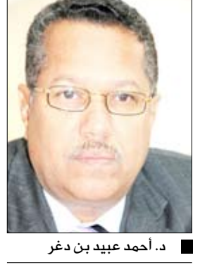
د. أحمد عبيد بن دغر

في سياق متصل اطلع وزير شؤون المغتربين على أوضاع الجالية اليمنية في كل من الدمام والأحساء والجبلين والخبر في المنطقة الشرقية بالمملكة. وناقش مع مسؤولي هذه الجاليات وعدد من رجال المال والأعمال في هذه المناطق القضايا المتعلقة بالوطن والمغتربين. وقدم الوزير شرحا عن المستجدات على الساحة الوطنية والدور الواجب على المغتربين القيام به تجاه وطنهم.. وحث المغتربين على الوقوف إلى جانب نهضة وطنهم وقيادته السياسية والتوجه معاً نحو بناء اليمن الحديث. إلى ذلك اطلع الوزير القهالي على تقرير من رئيس الجالية اليمنية بالمنطقة الشرقية صالح الضياني عن أوضاع الجالية في المنطقة بشكل عام وعن الرعاية التي يحظى بها المغتربون من السلطات في المملكة العربية السعودية.