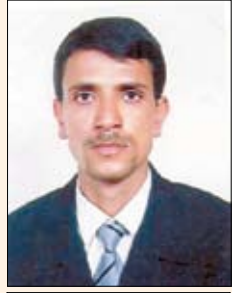
عبد الفتح علي البنوس

منح قانون السلطة المحلية محافظي المحافظات صلاحيات واسعة عززت من الدور المنشود من السلطات المحلية في إحداث طفرة تنموية وخدمية في المحافظات على اعتبار أن نظام السلطة المحلية قضى على المركزية وأبدلها بنظام اللامركزية الذي أتاح الفرصة للشعب بأن يحكم نفسه بنفسه، وعلى الرغم من بعض الممارسات غير القانونية التي ترتكب من حين لآخر من قبل بعض الوزراء والمسؤولين في الحكومة والتي تخالف قانون السلطة المحلية وتواصل تكريس مبدأ المركزية المقيتة إلا أن هذه الممارسات تظل محدودة وفردية وهو ما يتطلب إدارة أكثر حزمًا في المحافظات تضمن عام إفساح المجال أمام الآخرين للتدخل في شؤونها. والمتأمل اليوم لمستوى أداء غالبية المحافظين (يستوي في ذلك المنتخبون والمعينون) يصاب بالإحباط ويسارع إلى الحكم بالفشل على تجربة الحكم المحلي وييصم بالبنان العشر على أن انتخاب المحافظين من قبل المواطنين أو من يمثلهم في المجالس المحلية من اللعنات التي حلت على أحفاد سبأ وحمير.