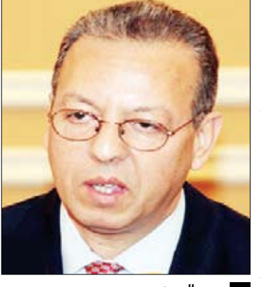
جمال بن عمر

بموجبه تجري عملية التحول والانتقال السلمي للسلطة في اليمن.. موضحا أن الأمين العام للأمم المتحدة بان كي مون يرى أن هذا الاتفاق يمكن أن يكون نموذجا لتحقيق السلام في دول بالمنطقة. وتطرق بن عمر إلى الأهمية التي يشكها مؤتمر الحوار الوطني المزمع انعقاده خلال المرحلة الانتقالية الثانية. وأكد أن نجاح أو فشل الحوار الوطني من الممكن أن يقيم أو يهدم نقل السلطة في اليمن وبالتالي ستكون أولوية الأمم المتحدة في اليمن خلال الأشهر المقبلة المساعدة في نجاحه.. معبدا عن تطلعه للعمل مع كافة الأطراف الدولية الفاعلة لتقديم الدعم لهذه العملية .