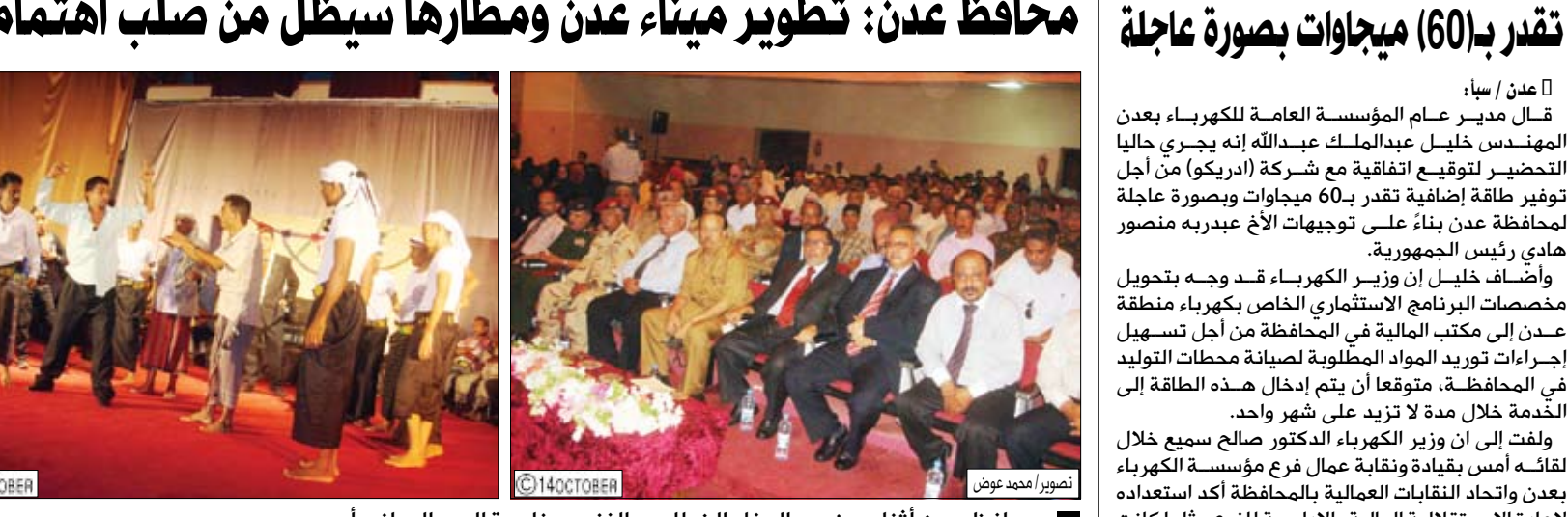
محافظ عدن أثناء حضوره الحفل الخطابي والفني بمناسبة العيد الوطني أمس