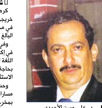
د. علي حسن الأحمدى

كرم محافظ شبوة الدكتور علي حسن الأحمدى أمس خريجي الدفع الثالث من المعهد الأمريكي للغات والكمبيوتر في مجال دبلوم اللغة الإنجليزية وعلوم وهندسة الحاسوب البالغ عددهم 50 طالباً.