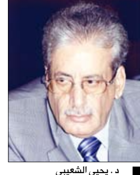
د. يحيى الشعيبي

أهابت اللجنة العليا لامتحانات بمدرء مكاتب التربية والتعليم في أمانة العاصمة وعموم المحافظات سرعة تسليم وثائق الطلاب الامتحانية للشهادتين الأساسية والثانوية. وحملت اللجنة في اجتماعها أمس برئاسة وزير التربية والتعليم الدكتور عبدالرزاق الأشول مكاتب التربية والتعليم مسؤولية التأخير الذي ستتخذ إزاءه الإجراءات القانونية اللازمة. وأشادت اللجنة بمكاتب التربية التي أنجزت متطلبات عملية الامتحانات وهي محافظات "أبين، مأرب، ذمار، البيضاء، حضرموت والساحل". وسكان نائب وزير التربية والتعليم رئيس اللجنة العليا لامتحانات الدكتور عبدالله الحمادي قد استعرض الترتيبات الخاصة بإنجاح عملية الامتحانات لهذا العام والصعاب التي لا زالت اللجنة عاكفة على معالجتها.