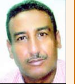
علي منصور مقرات

وبالقدر الذي شد انتباه السواد الأعظم من اليمنيين فإنه قد قوبل بارتياح واسع من مختلف فئات وشرائح الشعب اليمني الصابر كونه تناول مجمل الأوضاع والمستجدات الراهنة داخل الساحة الوطنية وتطورات الأحداث التي مازالت تهدد البلد والسلم الاجتماعي والأهلي من العاصمة صنعاء إلى آيين الأرض المحروقة وغيرها من المحافظات الملتهية التي صارت على صفيح ساخن من التدهور الأثني وأعمال العنف والتخريب والقتل والإرهاب المريع..