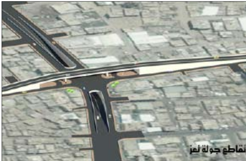
لقاطع جولة لمر