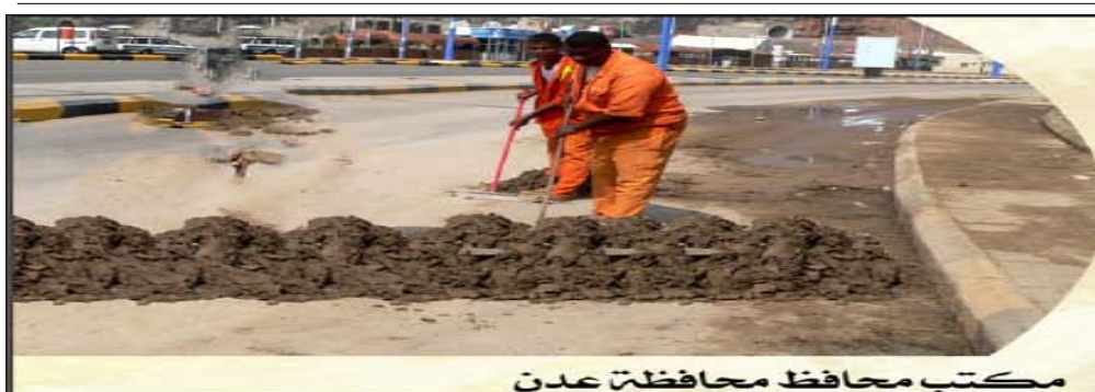
مكتب محافظ محافظة عدن