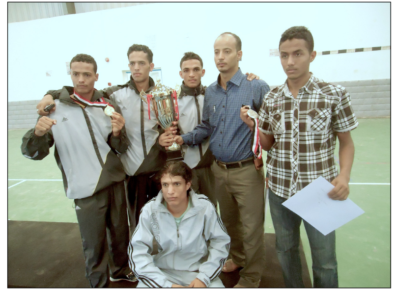
في نهائي بطولة الجمهورية التاسعة لرجال الكونغ فو