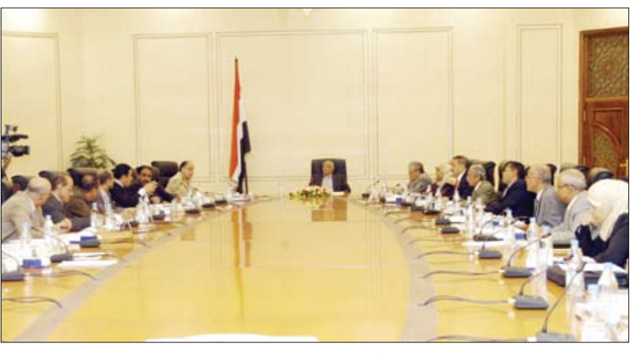
جانب من اجتماع مجلس الوزراء أمس

وافق مجلس الوزراء على اتفاقية تمويل مشروع برنامج التوظيف في الريف بقيمة 720 ألف وحدة من حقوق السحب الخاصة للمساهمة في تمويل مشروع يمن انفسست برنامج التوظيف في الريف، الذي يهدف إلى تحسين الوضع الاقتصادي للفقراء في الريف. ويركز البرنامج مبدئياً على سبع محافظات هي (إب، البيضاء، ذمار، حجة، الحديدة، لحج وتعرز).