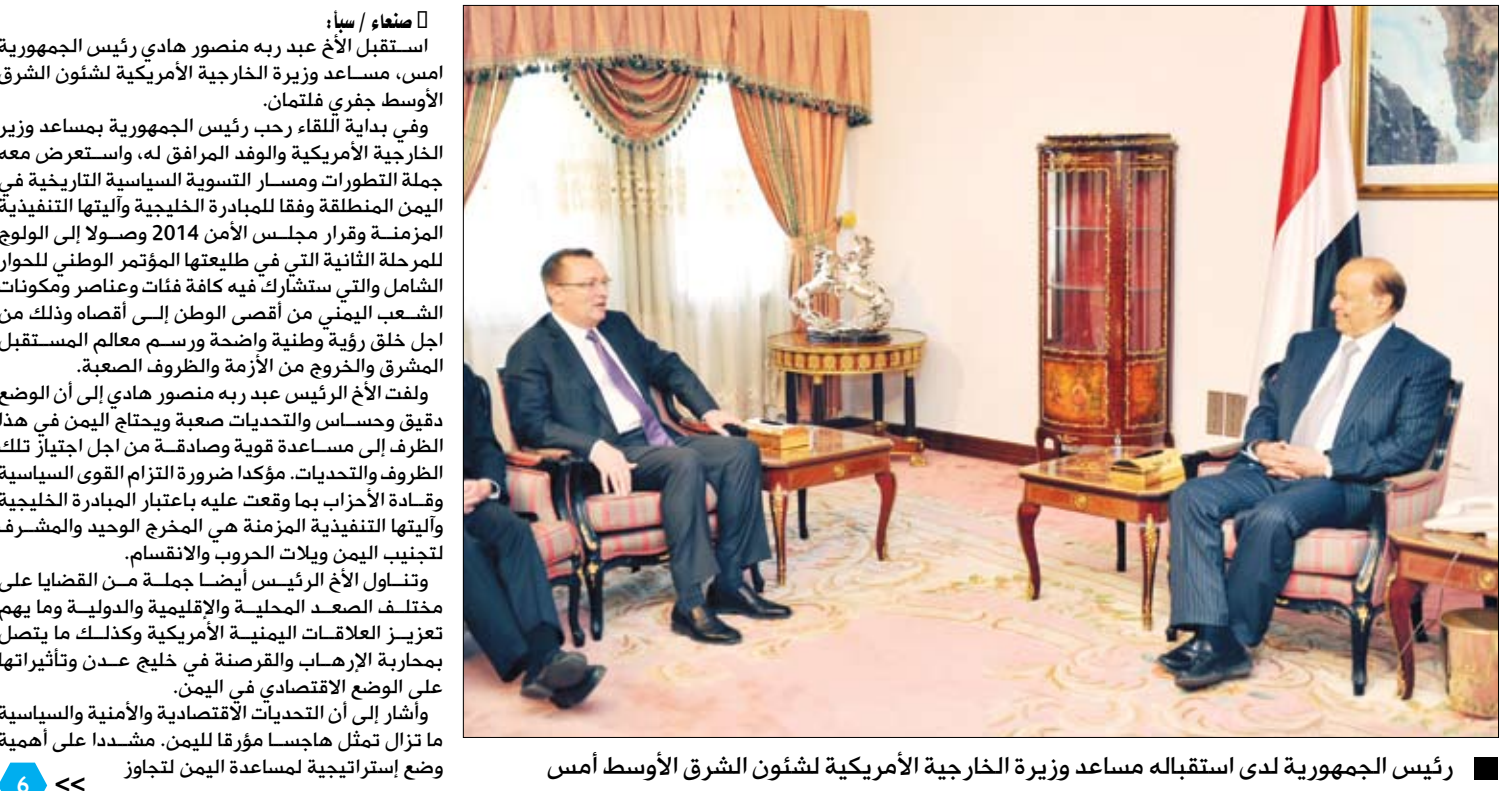
رئيس الجمهورية لدى استقباله مساعد وزيرة الخارجية الأمريكية لشؤون الشرق الأوسط أمس

استقبل مساعد وزيرة الخارجية الأمريكية لشؤون الشرق الأوسط الرئيس عبد ربه منصور هادي رئيس الجمهورية أمس، مساعد وزيرة الخارجية الأمريكية لشؤون الشرق الأوسط جيفري فلتان. وفي بداية اللقاء رحب رئيس الجمهورية بمساعد وزير الخارجية الأمريكية والوفد المرافق له، واستعرض معه جملة التطورات ومسار التسوية السياسية التاريخية في اليمن المنطلقة وفقاً للمبادرة الخليجية واليتها التنفيذية المزمرة وقرار مجلس الأمن 2014 وصولاً إلى الولوج للمرحلة الثانية التي في طليعتها المؤتمر الوطني للحوار الشامل والتي ستشارك فيه كافة فئات وعناصر ومكونات الشعب اليمني من أقصى الوطن إلى أقصاه وذلك من أجل خلق رؤية وطنية واضحة ورسم معالم المستقبل المشرق والخروج من الأزمة والظروف الصعبة. ولفت الأخ الرئيس عبد ربه منصور هادي إلى أن الوضع دقيق وحساس والتحديات صعبة ويحتاج اليمن في هذا الظرف إلى مساعدة قوية وصادقة من أجل اجتياز تلك الظروف والتحديات. مؤكداً ضرورة التزام القوى السياسية وقادة الأحزاب بما وقعت عليه باعتبار المبادرة الخليجية واليتها التنفيذية المزمرة هي المخرج الوحيد والمشرف لتجنيد اليمن ويلات الحروب والانقسام. وتناول الأخ الرئيس أيضاً جملة من القضايا على مختلف الصعد المحلية والإقليمية والدولية وما يهم مختلف العلاقات اليمنية الأمريكية وكذلك ما يتصل بمحاربة الإرهاب والقرصنة في خليج عدن وتأثيراتها على الوضع الاقتصادي في اليمن. وأشار إلى أن التحديات الاقتصادية والأمنية والسياسية ما تزال تمثل هاجساً موقراً لليمن. مشدداً على أهمية وضع إستراتيجية لمساعدة اليمن لتجاوز