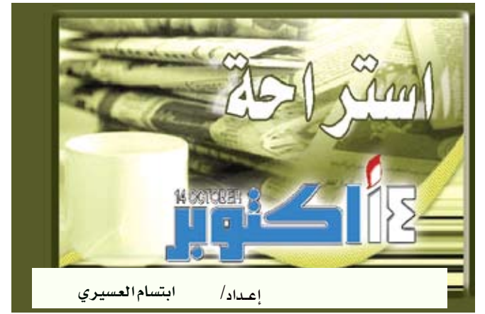
إعداد / ابتسام العسيري

إشتابولا / متابعة : لم يتردد 13 أمريكي في تقبيل بقرة بهدف التمكن من جمع المال لتسديد فاتورة علاج مريضة بالسرطان في أوهايو. وأفادت صحيفة «ذي ستار بيكون» الأميركية أن 13 متنافساً عمدوا إلى تقبيل البقرة «تاتيانا» في معها بعدما وافق متبرع مجهول على دفع ألف دولار مقابل قيامهم بذلك.