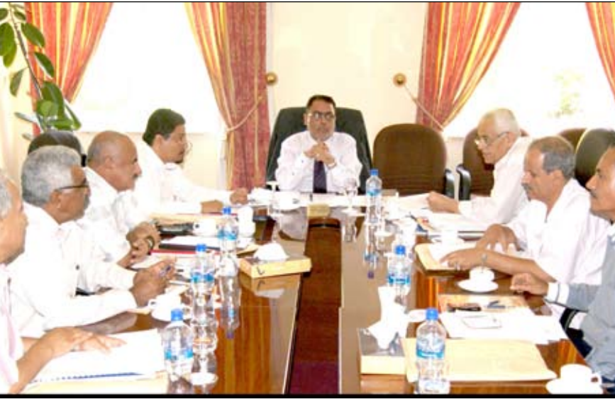
عدن / واد شيبلي :