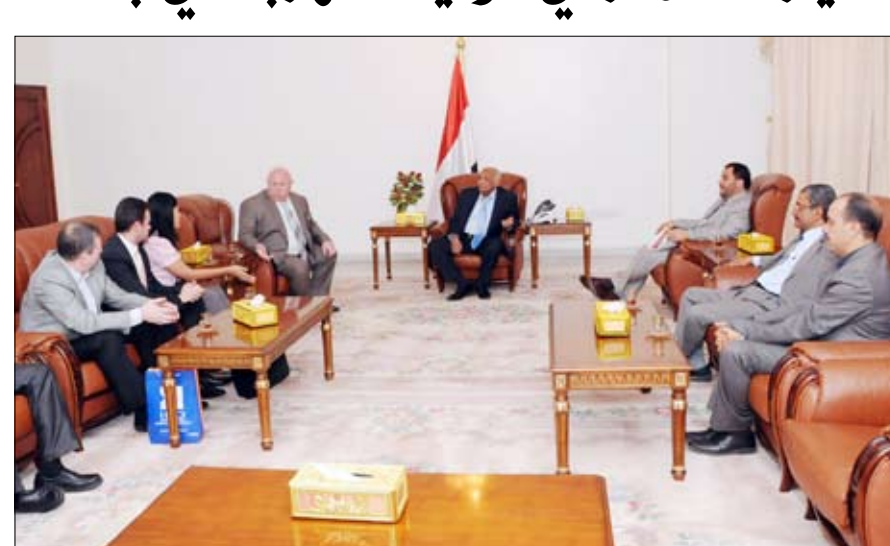
باسندوة لدى استقباله وفد مجموعة شركات "بي إي جي"

صنعاء / سبأ : استقبل الأخ رئيس مجلس الوزراء محمد سالم باسندوة أمس وفد مجموعة شركات "بي إي جي" الاستثمارية الأمريكية التركية الذين بلغوه اعترام المجموعة استثمار نحو ثلاثة مليارات دولار في مجال إنتاج وتوليد الطاقة الكهربائية في بلادنا. وأوضح المسؤولون في المجموعة أثناء المقابلة أن هناك مشاورات جارية مع المسؤولين في