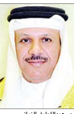
د. عبد اللطيف الزباني

السعودية الرياض خلال الفترة (23 - 24) إبريل القادم، وأليات وضع تصور مشترك ستقدمه الحكومة اليمنية والأمانة العامة لمجلس التعاون لأصدقاء اليمن. وفي الاجتماع رحب الزباني بزيارة الوفد اليمني، مؤكداً ووقوف دول مجلس التعاون مع الجمهورية اليمنية لتجاوز الظروف الحالية ومساعدتها على تنفيذ البرامج والخطط التنموية الهادفة إلى دفع عجلة البناء بما يلبي احتياجات الشعب اليمني الشقيق. كما عبر الزباني عن توافقه وثقته بعودة اليمن إلى الأمن والاستقرار إلى كافة أرجاء اليمن، مشيراً إلى أن دول أصدقاء اليمن أعربت عن استعدادها وتصميمها على مساعدة اليمن لتجاوز الظروف الصعبة في المرحلة الانتقالية الحالية ودعم مشاريع التنمية في اليمن. حضر اللقاء وزير المالية صخر الوجيه وسفير الجمهورية اليمنية لدى المملكة العربية السعودية محمد علي حسن الأجل وعبد من المسؤولين في وزارة التخطيط والتعاون الدولي ووزارة المالية. "وحضر الاجتماع من الأمانة العامة الأمين العام المساعد للشؤون السياسية الدكتور سعد العمار والأمين العام المساعد للحورات الإستراتيجية الدكتور عبد العزيز العويشق وعدد من المسؤولين بالأمانة.