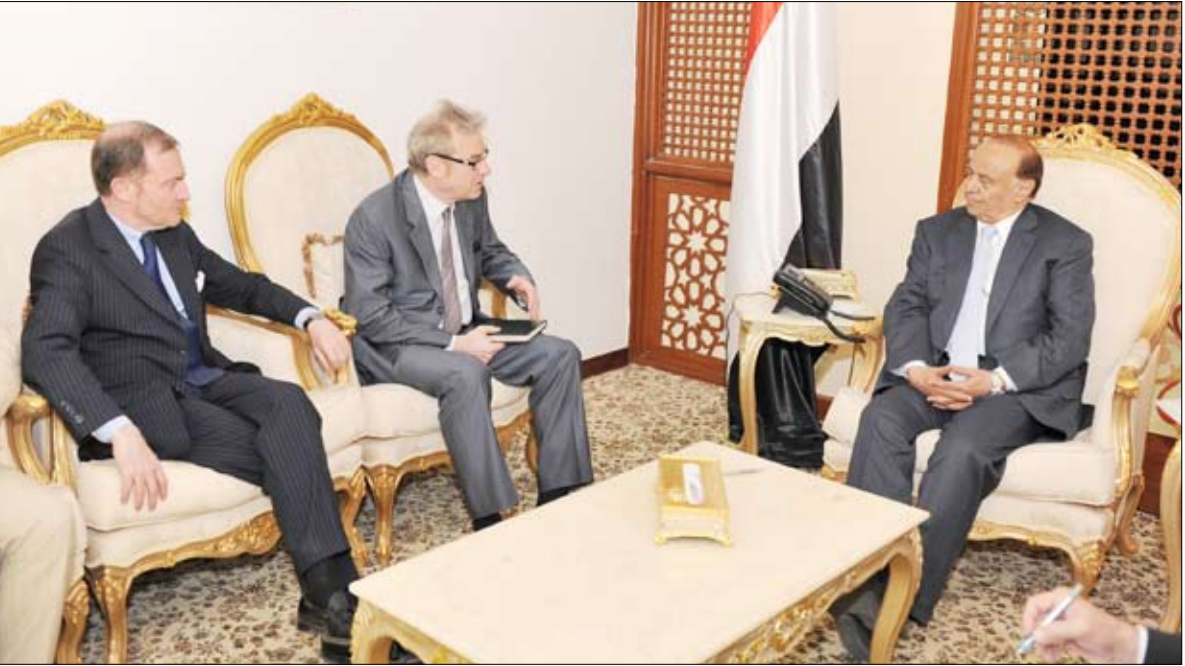
رئيس الجمهورية لدى استقباله مبعوث الحكومة الفرنسية أمس

صنعاء / سبأ : استقبل الأخ الرئيس عبد ربه منصور هادي رئيس الجمهورية مبعوث الحكومة الفرنسية مدير دائرة شمال أفريقيا والشرق الأوسط باتريس باولي والوفد المرافق له الذي وصل إلى صنعاء في زيارة تعبر عن دعم الحكومة الفرنسية ومساندتها للتسوية السياسية والتاريخية في اليمن. وبعد أن رحب الأخ الرئيس بالوفد الفرنسي استعرض الخطوات العملية التي تتم ترجمتها على أرض الواقع وفقاً لما جاء بالمبادرة الخليجية والتيها التنفيذية المزمرة وقرار مجلس الأمن رقم (2014) منذ التوقيع وحتى تشكيل حكومة الوفاق الوطني وصولاً إلى الانتخابات الرئاسية المبكرة التي جرت في أجواء ديمقراطية عبرت عن رغبة الشعب اليمني في التغيير والخروج من الظروف الصعبة والأزمة الطاحنة. وأشار الأخ الرئيس عبد ربه منصور هادي إلى المرحلة الثانية