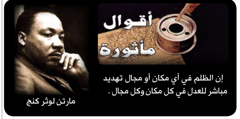
مارتن لوثر كنج

كان موقع أوتيك القديم جذابا للغاية فقد كانت تتوسط الطريق من قرطاج إلى مدينتي هيبوأكرا و هيبو ريجيوس المهمتين ما جعلها تزدهر بشكل كبير. و كان ذلك الإزدهار سببا للغيرة والتنافس المتبادل بين أوتيك و قرطاج و مع ذلك فقد خضعت المدينة للقرطاجيين ولكنها كانت دائما تتربح الفرص للتخلص منهم. وقد ورد ذكر المدينة في معاهدة 348 ق.م التجارية بين روما و قرطاج. وفي عام 310 ق.م سقطت المدينة بكل سهولة بيد أغاثاكوليس اليوناني في حربه ضد قرطاج. وفي