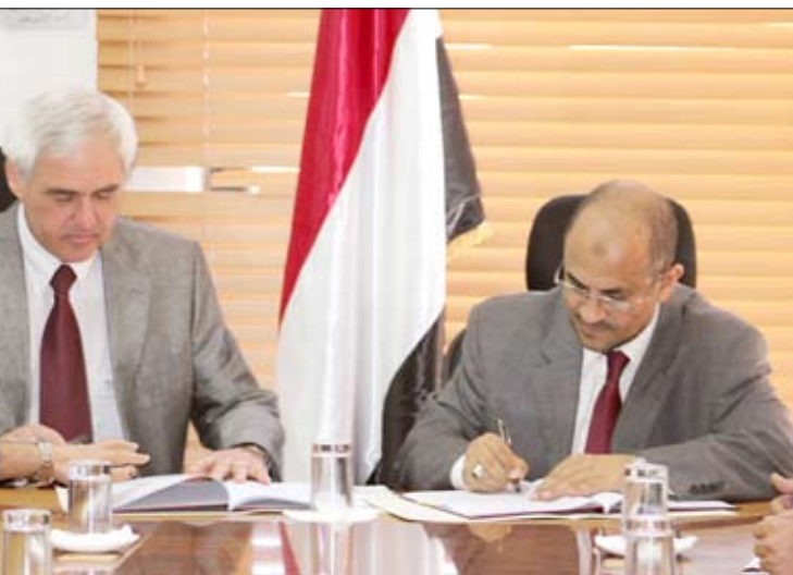
أثناء التوقيع على خطة عمل برنامج صندوق الأمم المتحدة للسكان

منعاه / سيا: وقع أمس بوزارة التخطيط والتعاون الدولي على وثيقة خطة عمل البرنامج القطري لصندوق الأمم المتحدة للسكان للأعوام 2012- 2015م بكلفة إجمالية تصل إلى 25 مليون دولار. وتضمن وثيقة خطة عمل البرنامج القطري لصندوق الأمم المتحدة للسكان التي وقعتها عن الجانب اليمني وزير التخطيط والتعاون الدولي الدكتور محمد السعدوي وعن جانب صندوق الأمم المتحدة للسكان الممثل المقيم لصندوق في اليمن "مارك فانون بروج" من ثلاثة مكونات رئيسية موزعة بين الصحة الإنجابية والسكان والتنمية ودعم النوع الاجتماعي في اليمن. وعقب التوقيع على وثيقة خطة عمل البرنامج القطري لصندوق الأمم