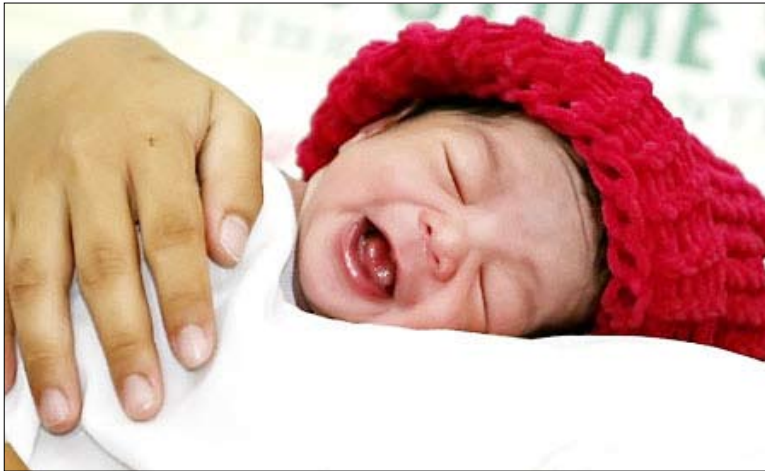
أبناء شرعيون.. ونخشي أيضاً أن تتكرر هذه المشكلة مع المتزوجين الذين يعقدون قرانهم في ظل حكومة الوفاق ولا يجدون عقوداً لتوثيق زواجهم.. والله من وراء القصد.

بالتزامن مع تشكيل حكومة الوفاق وتعيين وزير جديد للعدل اختفت من محافظة عدن شهادات ميلاد الأطفال وبدأ المازدونون الشرعيون يشكون من نفاذ عقود الزواج وعدم وجود أوراق عقود جديدة، حيث اختفت فجأة شهادات الميلاد وعقود الزواج من الجهات المختصة في عدن علماً بأن عقود الزواج التي اختفت تشتت توقيع الزوجة وهو ما أثار حفيظة جهات دينية حزبية شنت هجوماً شرساً على وزير العدل السابق بسبب إصراره على ضرورة توقيع الزوجة على عقد الزواج. الكثير من الآباء يشكون أن الشهادات وآلاف الأطفال الذين ولدوا في عدن منذ تشكيل حكومة الوفاق لم تصرف لهم حتى الآن شهادات ميلاد بسبب إختفائها وعدم توفرها في مكاتب السجل المدني بالمديريات، وكذلك الحال بالنسبة لعقود الزواج التي بدأت تنفذ ولم يجد المازدونون الشرعيون دفاتر عقود جديدة لأسباب غير مفهومة. نأمل ألا يبقى الأطفال الذين ولدوا في ظل حكومة الوفاق بدون شهادات ميلاد تثبت أنهم