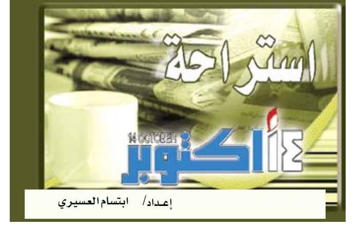
إعداد / ابتسام العسيري

□ أثرة / مناجات : باتت الموسيقى المعروفة منذ زمن تأثيرها على نفسياتنا، تقنية متوفرة في مستشفى تركي يعالج من خلالها المصابين بالاكتئاب ويرتفع ضغط الدم. ونقلت صحيفة «حريت» التركية عن المسؤول عن قسم جراحة القلب في مستشفى «ميموريال» بينغور سونمير قوله «بإمكاننا معالجة المرضى المكتئبين والمصابين بارتفاع ضغط الدم خلال 15 دقيقة بالموسيقى». وأشار إلى أن المستشفى يستخدم العلاج بالموسيقى مرتين في اليوم، حيث يستمع المرضى لعزف حي على الناي مدة 15 دقيقة كل صباح ومساءً. وقال الطبيب إن «الأشخاص الذين يعالجون بالموسيقى يصبحون أشخاصاً مختلفين خلال فترة قصيرة جداً من الوقت».