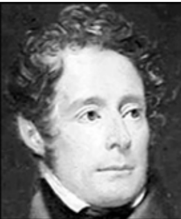
الشاعر الفرنسي لامارتين