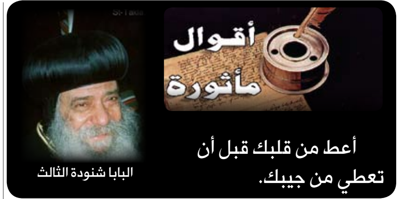
البابا شنودة الثالث