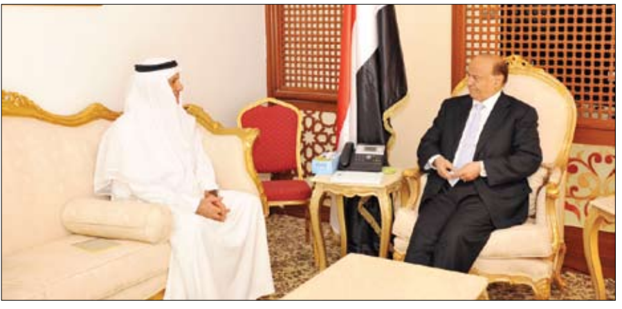
.. ولدى استقباله السفير السعودي أمس

صنعاء / سيا : استقبل الأخ عبد ربه منصور هادي نائب رئيس الجمهورية مع وزير الإعلام علي أحمد المرزوق في مكتبه في صنعاء، وذلك في إطار العلاقات الأخوية بين البلدين الشقيقين في مختلف المجالات، وكذا مناقشة الأوضاع الراهنة والمستجدات الأخيرة على الساحة الوطنية.