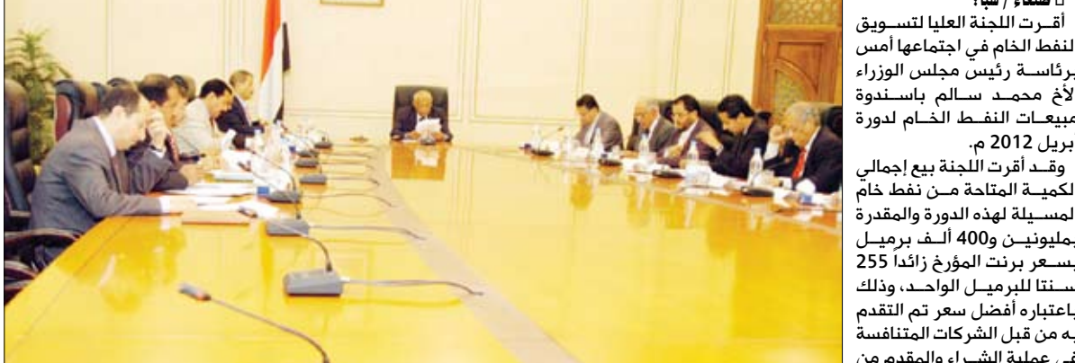
من اجتماع لجنة تسويق النفط أمس

صنعاء / سيا : أقرت اللجنة العليا لتسويق النفط الخام في اجتماعها أمس برئاسة رئيس مجلس الوزراء الأخ محمد سالم باسندوة مبيعات النفط الخام لدورة أبريل 2012 م. صنعاء / سيا : أقرت اللجنة العليا لتسويق النفط الخام في اجتماعها أمس برئاسة رئيس مجلس الوزراء الأخ محمد سالم باسندوة مبيعات النفط الخام لدورة أبريل 2012 م.