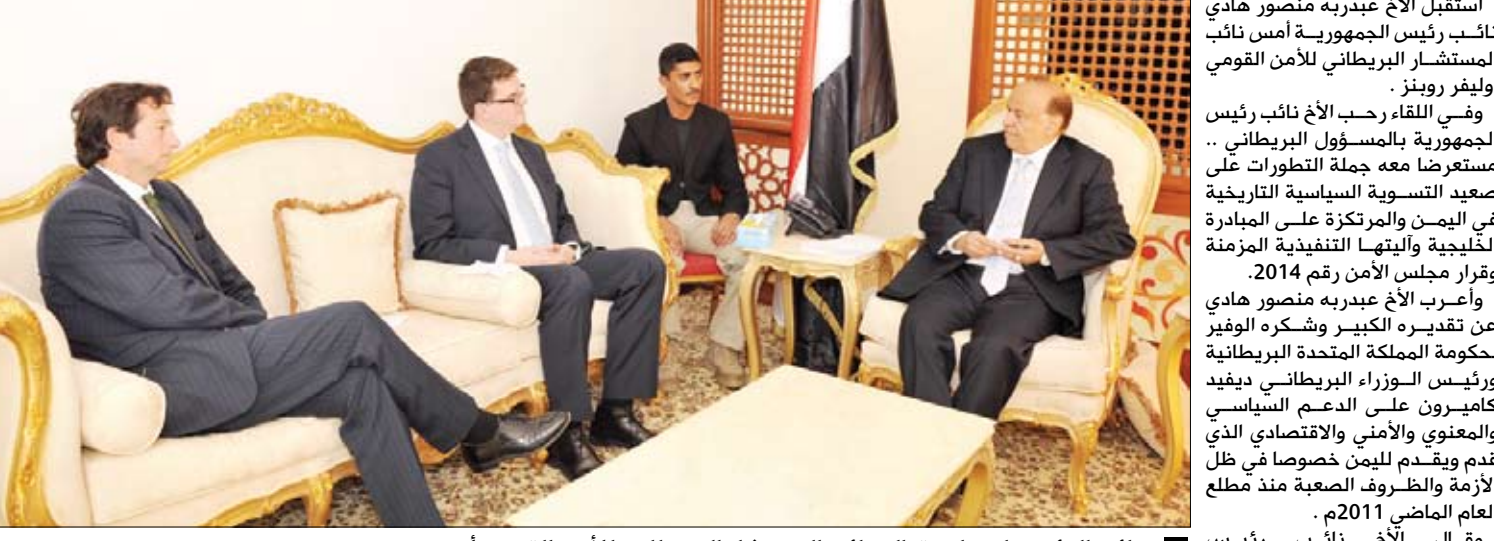
نائب الرئيس لدى استقباله نائب المستشار البريطاني للأمن القومي أمس

صنعاء / سيا : استقبل الأخ عبد ربه منصور هادي نائب رئيس الجمهورية مع وزير الإعلام علي أحمد المرزوق في مكتبه في صنعاء، وذلك في إطار العلاقات الأخوية بين البلدين الشقيقين في مختلف المجالات، وكذا مناقشة الأوضاع الراهنة والمستجدات الأخيرة على الساحة الوطنية. صنعاء / سيا : استقبل الأخ عبد ربه منصور هادي نائب رئيس الجمهورية مع وزير الإعلام علي أحمد المرزوق في مكتبه في صنعاء، وذلك في إطار العلاقات الأخوية بين البلدين الشقيقين في مختلف المجالات، وكذا مناقشة الأوضاع الراهنة والمستجدات الأخيرة على الساحة الوطنية.