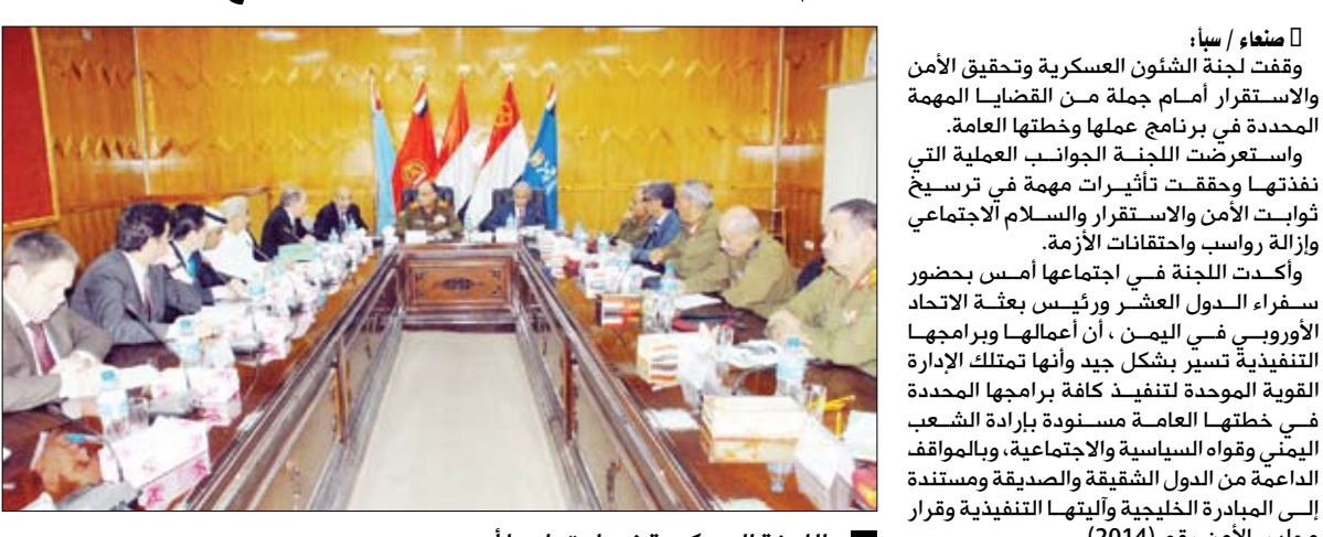
اللجنة العسكرية في اجتماعها أمس

صنعاء / سيا : وقفت لجنة الشؤون العسكرية وتحقيق الأمن والاستقرار أمام جملة من القضايا المهمة المحددة في برنامج عملها وخطلتها العامة، واستعرضت اللجنة الجوانب العملية التي نفذتها وحققته تأثيرات مهمة في ترسيخ ثوابت الأمن والاستقرار والسلام الاجتماعي وإزالة رواصب واحتقانات الأزمة. صنعاء / سيا : وقفت لجنة الشؤون العسكرية وتحقيق الأمن والاستقرار أمام جملة من القضايا المهمة المحددة في برنامج عملها وخطلتها العامة، واستعرضت اللجنة الجوانب العملية التي نفذتها وحققته تأثيرات مهمة في ترسيخ ثوابت الأمن والاستقرار والسلام الاجتماعي وإزالة رواصب واحتقانات الأزمة.