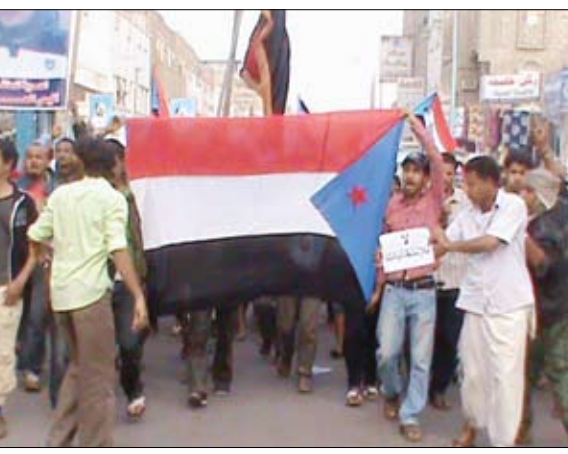
جانب من مسيرة شباب (16) فبراير أمس

□ عدن / لطفي المنذري: انطلقت المسيرة التي دعا إليها شباب ثورة (16 فبراير) الجمعة 20 / 01 / 2012. وقد جابت المسيرة شوارع المنصورة الفرعية والرئيسية إلى سجن المنصورة الذي ردد فيه الشباب شعارات تطالب بإطلاق سراح المعتقلين الجنوبيين ، وطلبي ابو الزبير. وقد نددت المسيرة بأحداث 13 يناير 2012 في ساحة الحرية في خور مكسر ومقتل عدد من أبناء عدن المنحرفين في الأمن العام الذين استشهدوا صباحة يوم الجمعة 20 / 01 / 2012. وقد جابت المسيرة شوارع المنصورة الفرعية والرئيسية إلى سجن المنصورة الذي ردد فيه الشباب شعارات تطالب بإطلاق سراح المعتقلين الجنوبيين ، وطلبي ابو الزبير. وقد نددت المسيرة بأحداث 13 يناير 2012 في ساحة الحرية في