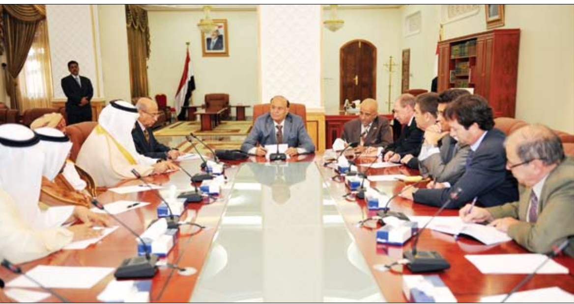
نائب الرئيس لدى لقائه سفراء الدول الدائمة العضوية بمجلس الأمن ودول مجلس التعاون أمس

□ صنعاء / سبأ : التقى الأخ عبد ربه منصور هادي نائب رئيس الجمهورية أمس سفراء الدول الدائمة العضوية بمجلس الأمن الدولي ، وكذلك سفراء دول مجلس التعاون الخليجي ، وذلك لإطلاعهم على سير تنفيذ المبادرة الخليجية وأيتها الزمنة وقرار مجلس الأمن الدولي رقم 2014 لتنفيذ التسوية السياسية التاريخية وإخراج اليمن من الظروف والأزمة التي عصفت به منذ مطلع العام الماضي 2011م ، وتسببت بأثار كارثية على مختلف المستويات الاقتصادية والسياسية والأمنية ومست أضرارها المجتمع اليمني بكلمه من شرقه إلى غربه ومن شماله إلى جنوبه . وقد استعرض الأخ نائب رئيس الجمهورية جملة تلك المعطيات المتصلة بتنفيذ المبادرة وصولا إلى إصدار مجلس النواب قانون الحصانة من المساءلة القانونية والقضائية للرئيس علي عبد الله صالح مع تزكية مرشح الرئاسة التوافقي للمرحلة الانتقالية المشير عبد ربه منصور هادي . وتناول الأخ نائب رئيس الجمهورية في كلمته طبيعة الجهود الحثيثة التي بذلت في سبيل الوصول إلى تلك النتائج الطيبة في طريق إخراج اليمن إلى بر الأمان.. منوها بالأهمية الاستثنائية للتعاون المطلق والكامل من كل الأشقاء والأصدقاء لتحقيق تلك الغايات والوصول إلى الأهداف المنشودة.. مشيدا بالجهود الاستثنائية الرائعة التي بذلت من قبل السفراء وكل القوى السياسية الخيرة . وقال : نحن اليوم في بداية المشوار وعلى الطريق الصحيح وبالاتجاه إلى يوم الحادي والعشرين من فبراير القادم للانطلاق القوي صوب المستقبل المنشود وبناء الدولة المدنية الحديثة ، وإجراء الإصلاحات بكل الاتجاهات بما يؤمن مسيرة ناجحة ومتغيرات عميقة باتجاه تحقيق الأمل والطموحات العريضة لأبناء شعبنا اليمني الأبي . التفاصيل 3ص