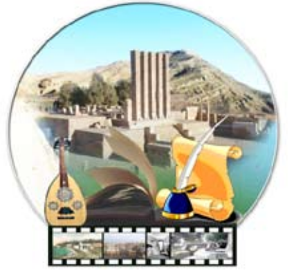
إشراف / فاطمة رشاد

القاهرة / متابعة، في إطار سعى إدارة مهرجان القاهرة الدولي لسينما الأطفال لإضافة بعض اللمسات لتطوير الدورة الـ 21 من المهرجان التي تنطلق في مارس المقبل، أكدت اللجنة الإعلامية للمهرجان أن اللجنة العليا تدرس حاليا سبل تطوير تشكيل لجان المشاهدة والتحكيم لتضم عناصر سينمائية شابة ومتخصصة ليرتدي المهرجان هذا العام ثوبا جديدا تتصافر فيه الخبرة مع الروح الشبابية. كما ناقشت اللجنة ما طرحته إدارة المهرجان حول