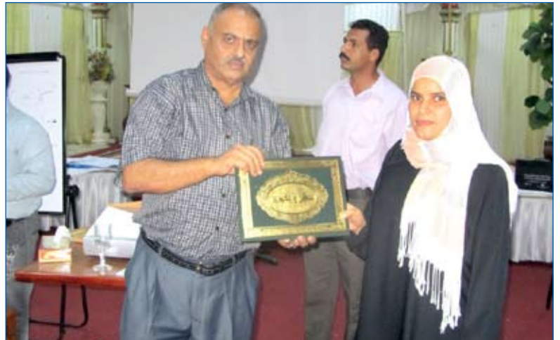
تم توزيع الشهادات التقديرية للمشاركين وجوائز تجربتنا معهم رائعة جدا .