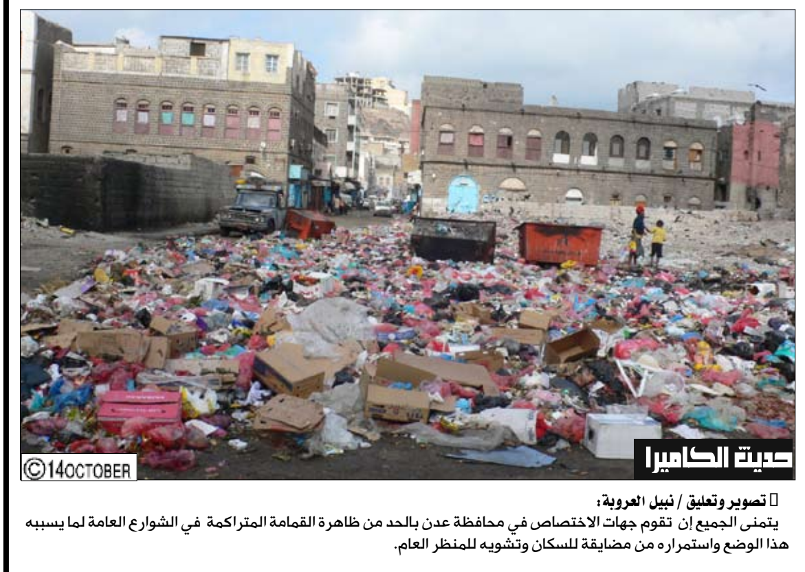
مدينة الكاهيرا يتمنى الجميع أن تقوم جهات الاختصاص في محافظة عدن بالحد من ظاهرة القمامة المتراكمة في الشوارع العامة لما يسببه هذا الوضع واستمراره من مضايقة للسكان وتشويه للمنظر العام.

في خطوة تسويقية ذكية لمطعم بيغ ماما أند بابا البيتزا في كاليفورنيا في الولايات المتحدة الأمريكية فقد أضاف إلى قائمة الطعام لديه بيتزا عملاقة للحصول على لقب أكبر بيتزا في العالم يمكن طلبها من قائمة الطعام في موسوعة جينيس للأرقام القياسية العالمية. و يبلغ عرض البيتزا 1.37 متر وطولها 1.37 متر و يبلغ ثمنها 199 دولارا أمريكيا