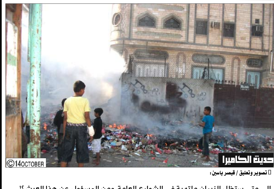
مدينة الكاميرا إلى متى ستظل النيران ملتهبة في الشوارع العامة ومن المسؤول عن هذا العبث؟! تصوير وتعليق / قيصر ياسين