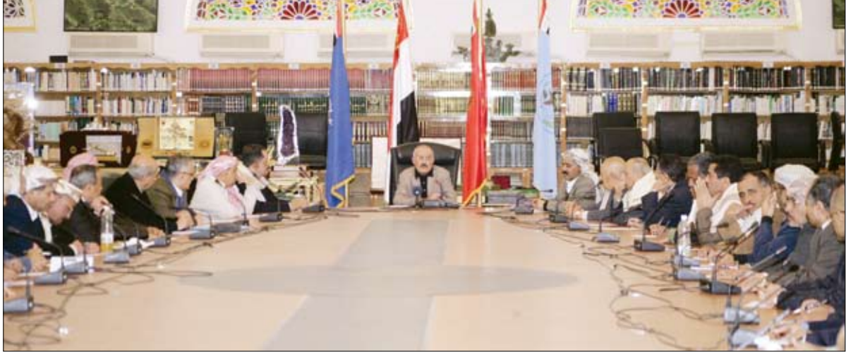
من اجتماع اللجنة العامة للمؤتمر والهيئة الوزارية برئاسة رئيس الجمهورية أمس

رأس فخامة الأخ الرئيس علي عبدالله صالح رئيس الجمهورية رئيس المؤتمر الشعبي العام مساء أمس اجتماعاً للجنة العامة للمؤتمر والهيئة الوزارية جرى فيه مناقشة عدد من القضايا المدرجة في جدول الأعمال والوقوف أمام المستجدات على الساحة الوطنية وخاصة ما يتعلق بالالتزام بتنفيذ المبادرة الخليجية وآليتها التنفيذية الزمته كمنظومة متكاملة لا تقبل التجزئة أو الانتقائية أو المماطلة. كما وقف الاجتماع أمام الاعتداءات المتعاقبة على مؤسسات الدولة والممارسات الاستفزازية بهدف خلق الفوضى الهمجية وتعطيل الأعمال والإضرار بالمصلحة العامة ومصالح المواطنين في عملية مكشوفة وبخطة فوضوية تستهدف في جوهرها ضرب الأركان الأساسية التي تقوم عليها مرحلة الوفاق الوطني وعرقلة الخطوات المطلوبة عاجلاً لمواصلة السير قدماً في تنفيذ مضامين المبادرة الخليجية وآليتها التنفيذية الزمته وافشال أعمال وخطة اللجنة العسكرية وتحقيق الأمن والاستقرار والوصول بها إلى طريق مسدود من خلال عدم الالتزام بإزالة المتارس والنقاط وإخلاء العاصمة من القوة العسكرية والعناصر المسلحة فضلاً عن الاعتداءات على مقرات المؤتمر الشعبي العام كما حدث في بعض دوائر محافظة تعز والدائرة 12 في أمانة العاصمة من قبل عناصر عدوانية تابعة للفرقة الأولى مدرع. وفي هذا الصدد عبر الاجتماع عن تمسكه الشديد الذي لا رجعة عنه بتنفيذ كل ما تضمنته المبادرة والآلية التي يتعين الالتزام بها من قبل الجميع دون مراوغة أو التفاف أو محاولة للطنن في الصور التي تحمل التسامح وتمسك