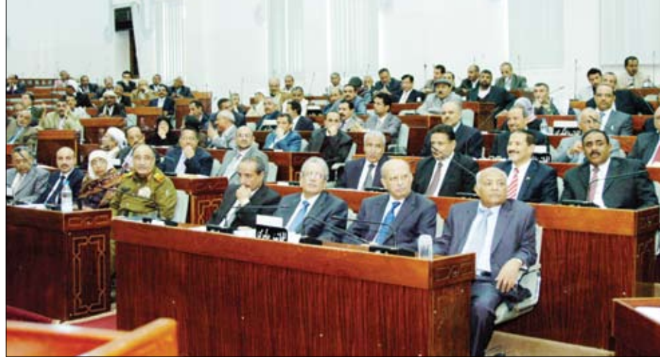
من جلسة مجلس النواب أمس

واصلاح الإدارة المالية العامة، بالتركيز على الإجراءات وجعل الإنفاق العام في مواقعه السلمية، وأن تسود تلك السياسات الشفافية، وأن يكون ترشيد الإنفاق لصالح