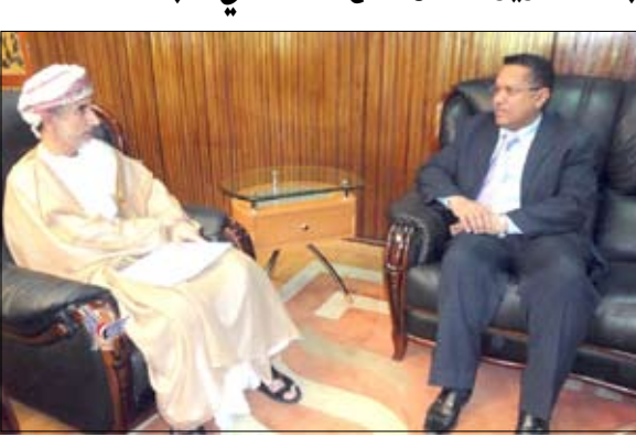
السفراء / سيا : بحث وزير الاتصالات وتقنية المعلومات الدكتور أحمد عبيد بن دغر أمس مع سفير سلطنة عمان بصنعاء عبد الله البادي علاقات التعاون الثنائي بين البلدين الشقيقين وسبل تعزيزها وتطويرها خاصة في قطاع الاتصالات وتقنية المعلومات.

وفي اللقاء أكد وزير الاتصالات أهمية تعزيز علاقات التعاون المشترك بين البلدين في مجال الاتصالات وتقنية المعلومات وضرورة استكمال المشاريع المشتركة بين الجانبين بما يفتح آفاقاً أوسع نحو تعزيز العلاقات اليمنية العمانية التي لها أبعاد تاريخية وجغرافية وثقافية. من جانبه أكد السفير العماني حرص بلاده على توطيد أواصر العلاقات المتميزة بين الشعبين الشقيقين، وتقديم كل ما من شأنه المضي بهذه العلاقة نحو آفاق أكثر تقدماً.