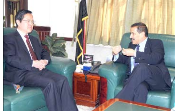
السفراء / سيا : وأمن واستقرار اليمن ودعم مسيرة التنمية فيه.

من جانبه أكد السفير الصيني دعم بلاده لإنجاح مهام حكومة اليمن التي مر بها خلال العشرة الأشهر الماضية. وأشار إلى أن الحكومة الصينية تعززها وتطويرها. وفي اللقاء أكد وزير النفط والمعادن أن حكومة الوفاق الوطني ستقدم كافة التسهيلات لاستئناف عمل الشركات العاملة في مجال النفط والمجالات الأخرى لما من شأنه تشجيع الشركات من مختلف الجنسيات للعودة لممارسة أنشطتها في اليمن. وأشاد الوزير هشام شرف بدعم حكومة الصين المستمر لوحدة