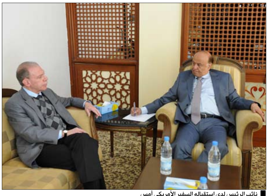
نائب الرئيس لدى استقباله السفير الأمريكي أمس

□ صنعاء / سيا: استقبل الأخ عبدربه منصور هادي نائب رئيس الجمهورية أمس سفير الولايات المتحدة الأمريكية لدى اليمن جيرالد فايرستين. وجرى خلال اللقاء مناقشة سير تنفيذ المبادرة الخليجية وآلياتها المزمعة في مختلف جوانبها واتجاهاتها، وكذلك المستجدات على الساحة اليمنية. وأكد الأخ عبدربه منصور هادي نائب رئيس الجمهورية ضرورة التزام جميع الأحزاب والقوى السياسية بالتهدئة والتزام قواعدها بعدم التصعيد أو أي نشاطات وأعمال قد تتعارض وسير التهدئة وترجمة التسوية السياسية التاريخية وفقاً لقرار مجلس الأمن رقم 2014 الذي ارتكز على بنود المبادرة الخليجية وآلياتها المزمعة. وأشار الأخ نائب رئيس الجمهورية إلى أن الشعب اليمني قد عانى أشد المعاناة وتجرع مرارة الألم منذ نشوب هذه الأزمة بداية العام الحالي.. داعياً الجميع إلى مراعاة حقوق الشعب في الحياة الكريمة وتوفير متطلباتها الحياتية بصورة كاملة. وعبر الأخ نائب رئيس الجمهورية عن بالغ الشكر والتقدير للسفير الأمريكي بصنعاؤه وجهوده الحثيثة في سبيل إخراج اليمن من الأزمة والظروف الراهنة وذلك ترجمة لاهتمامات الولايات المتحدة الأمريكية التي وصف الأخ نائب رئيس الجمهورية دورها بالحيو والبناء انطلاقاً من حرصها على سلامة وأمن واستقرار ووحدة اليمن. وقد أكد السفير الأمريكي خلال اللقاء حرص الولايات المتحدة الأمريكية والمجتمع الدولي على إخراج اليمن من الأزمة بصورة آمنة بما يحفظ له أمنه وسيادته واستقراره والتعاون الكامل في كل ما يصب في مصلحة الشعب اليمني وإخراجه من أزمته الراهنة. وأشار السفير فايرستين إلى أن واشنطن تتابع مع كُتُب سير عملية التسوية السياسية في اليمن وأنها تعمل من أجل أمن واستقرار اليمن ووحدته.