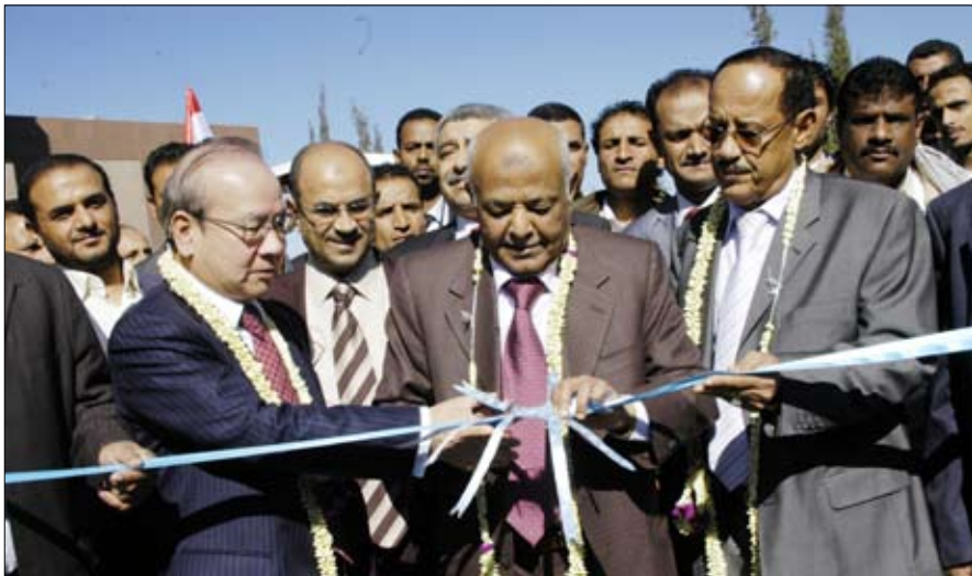
رئيس الوزراء خلال تدشينه توزيع (347) حراثة للمزارعين والجمعيات الزراعية

□ صنعاء / سيا: دشن رئيس مجلس الوزراء الأخ محمد سالم باسندوة أمس بصنعاؤه توزيع 347 حراثة للمزارعين والجمعيات الزراعية والمزارع العامة في إطار مكون المعونة اليابانية للمزارعين الفقراء للعام 2009م. وفي حفل التدشين القي الأخ رئيس مجلس الوزراء كلمة عبر فيها عن شكره وتقديره لقيادة الحكومة والشعب اليمني عن الشكر الجزيل للحكومة والشعب الياباني الصديق على هذه المساعدات المهمة والسخية لتطوير الزراعة اليمنية، منوها بحرص الحكومة اليابانية الصديقة دوماً على تقديم المساعدات للشعب اليمني وفي كل الظروف والأحوال. ولفت الأخ باسندوة إلى الحاجة الماسة لليمن لمثل هذه المساعدات لتطوير الأمن الغذائي في ظل الظروف الصعبة التي يمر بها الوطن. وأكد رئيس مجلس الوزراء أن حكومة الوفاق الوطني عازمة على تجاوز كل الصعوبات الراهنة وإعادة اليمن إلى مساره الصحيح.. مشيراً إلى أن الحكومة ستعمل بكل جهدها