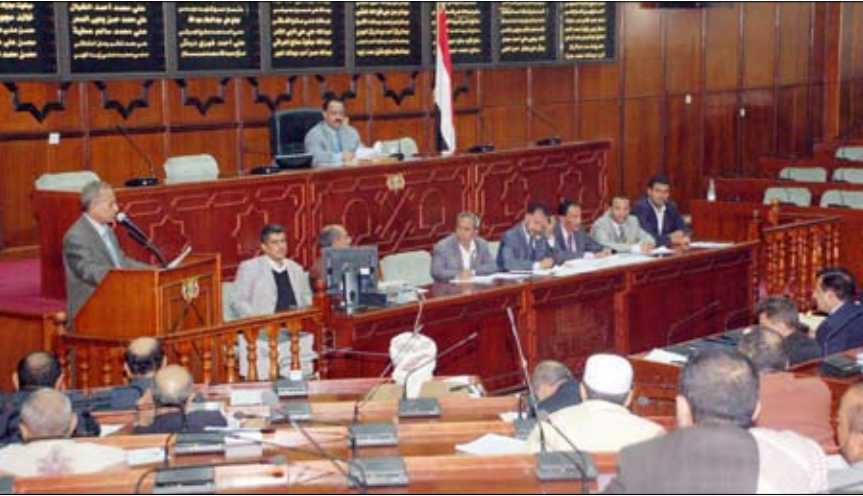
من جلسة مجلس النواب أمس

□ صنعاء / سيا: دعا مجلس النواب في جلسته المنعقدة أمس برئاسة رئيس المجلس يحيى علي الراعي، رئيس وأعضاء حكومة الوفاق الوطني للحضور اليوم الاثنين الموافق 26 ديسمبر الجاري وذلك لمناقشة برنامج العام للحكومة والتي كان قد بدأها يوم أمس الأول.