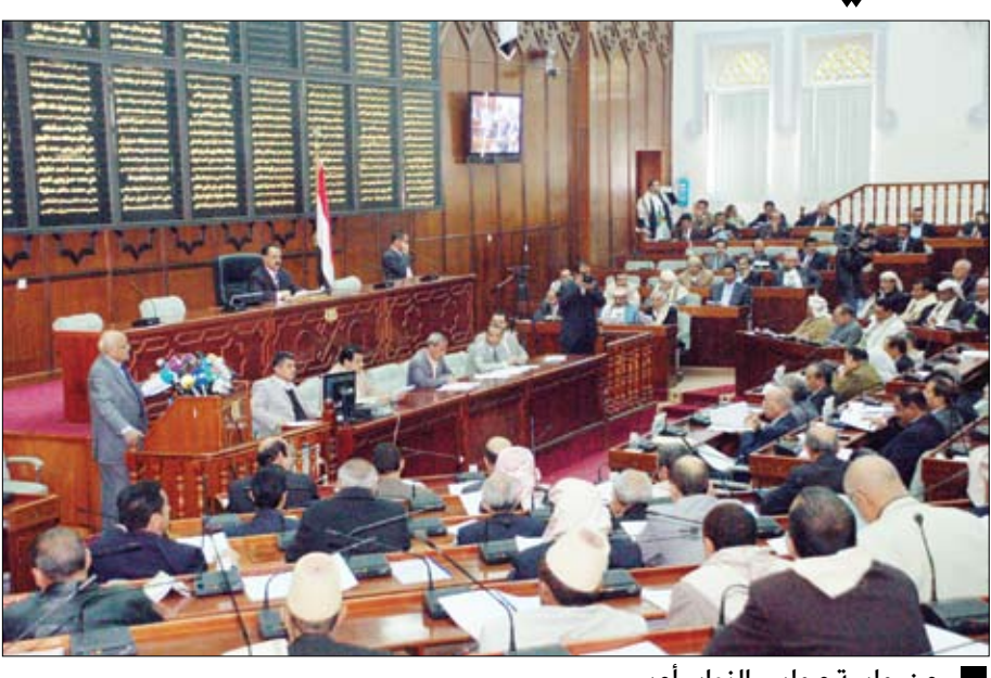
من جلسة مجلس النواب أمس

صنعاء / سيا : استمع مجلس النواب في جلسته المنعقدة أمس برئاسة رئيس المجلس الأخ/ يحيى علي الراعي إلى البرنامج العام للحكومة الذي قدمه رئيس مجلس الوزراء الأخ/ محمد سالم باسندوة بحضور أعضاء الحكومة وأعضاء مجلس النواب من كافة الكتل البرلمانية للأحزاب والتنظيمات السياسية الممثلة بالمجلس والمستقلين. وفي مستهل الجلسة التى رئيس مجلس النواب كلمة بهذه المناسبة رحب في مستهلها برئيس وأعضاء حكومة الوفاق الوطني باسمه وأعضاء مجلس النواب. وقال " ثقا أن العمل سيكون بين السلطتين التشريعية والتنفيذية تضامنياً وتكاملياً ، بحيث تشكل الشراكة الوطنية عاملاً حقيقياً في تحمل المسؤولية وأداء الواجبات وفقاً لمتطلبات المبادرة الخليجية والبيها التنفيذية الزممة وما تضمنه قرار مجلس الأمن الدولي رقم ( 2014 ) بالإضافة إلى المستجدات الوطنية التي يفرضها واقع الحياة اليومية المعيشية للناس". وأكد ضرورة العمل على تهيئة الأجواء والمناخات اللازمة، من أجل استمرار تحقيق التنمية المستدامة في كافة المجالات ومواصلة مسيرة البناء والإصلاحات والحفاظ على المكاسب والمنجزات الوطنية التي تحققت للوطن والشعب اليمني في ربيع السعيدة في ظل القيادة الحكيمة لفخامة الأخ الرئيس علي عبدالله صالح رئيس الجمهورية. وأضاف رئيس مجلس النواب " وفي الوقت الذي نشيد فيه بجهود الأخ عبدربه منصور هادي نائب رئيس الجمهورية، في متابعة تنفيذ المبادرة الخليجية والبيها التنفيذية الزممة،