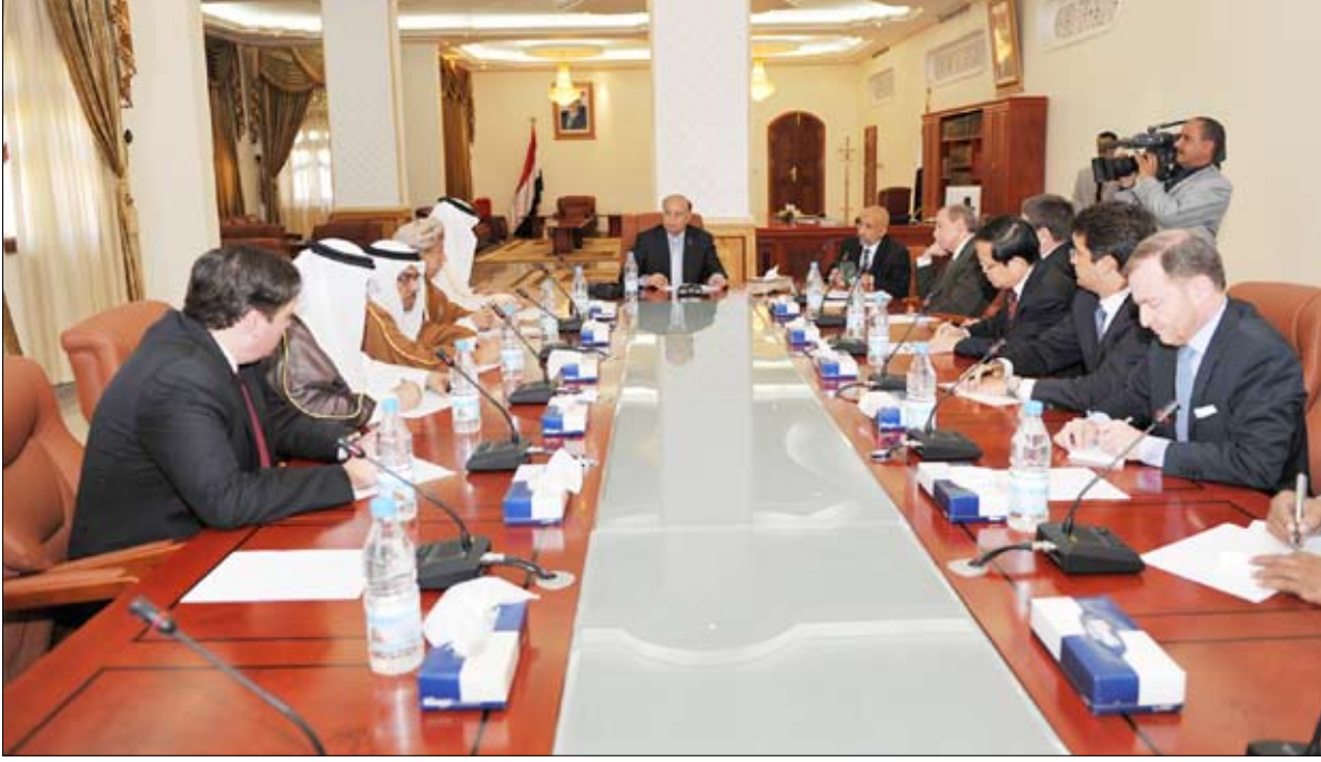
نائب الرئيس لدى لقاءه سفراء دول مجلس الأمن والاتحاد الأوروبي وسفراء دول مجلس التعاون الخليجي أمس

صنعا / سبأ: أقر مجلس الوزراء في اجتماعه أمس برئاسة سالم باسندوة مشروع البرنامج العام لحكومة الوفاق الوطني، المقرر تقديمه إلى مجلس النواب. حيث وافق المجلس على مشروع البرنامج المقدم من اللجنة الوزارية المشكلة لهذا الغرض وفقاً لقرار مجلس الوزراء رقم 73 لعام 2011م برئاسة وزير التعليم العالي والبحث العلمي، مع استيعاب الملاحظات المقدمة من أعضاء المجلس. وكلف المجلس وزير التعليم العالي والبحث العلمي وأمين عام مجلس الوزراء مراجعة مشروع البرنامج في ضوء الملاحظات المقدمة من أعضاء المجلس واعادته للنواب. حيث وافق المجلس على مشروع البرنامج المقدم من اللجنة الوزارية المشكلة لهذا الغرض وفقاً لقرار مجلس الوزراء رقم 73 لعام 2011م برئاسة وزير التعليم العالي والبحث العلمي، مع استيعاب الملاحظات المقدمة من أعضاء المجلس واعادته للنواب. كما كلف رئيس مجلس الوزراء