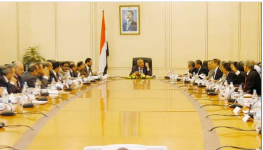
مجلس الوزراء في اجتماعه أمس

صنعا / سبأ: أقر مجلس الوزراء في اجتماعه أمس برئاسة سالم باسندوة مشروع البرنامج العام لحكومة الوفاق الوطني، المقرر تقديمه إلى مجلس النواب. حيث وافق المجلس على مشروع البرنامج المقدم من اللجنة الوزارية المشكلة لهذا الغرض وفقاً لقرار مجلس الوزراء رقم 73 لعام 2011م برئاسة وزير التعليم العالي والبحث العلمي، مع استيعاب الملاحظات المقدمة من أعضاء المجلس. وكلف المجلس وزير التعليم العالي والبحث العلمي وأمين عام مجلس الوزراء مراجعة مشروع البرنامج في ضوء الملاحظات المقدمة من أعضاء المجلس واعادته للنواب. حيث وافق المجلس على مشروع البرنامج المقدم من اللجنة الوزارية المشكلة لهذا الغرض وفقاً لقرار مجلس الوزراء رقم 73 لعام 2011م برئاسة وزير التعليم العالي والبحث العلمي، مع استيعاب الملاحظات المقدمة من أعضاء المجلس واعادته للنواب. كما كلف رئيس مجلس الوزراء