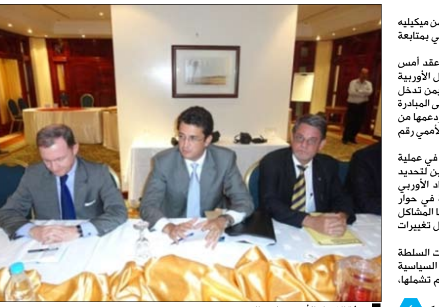
بعثة الاتحاد الأوروبي لدى اليمن