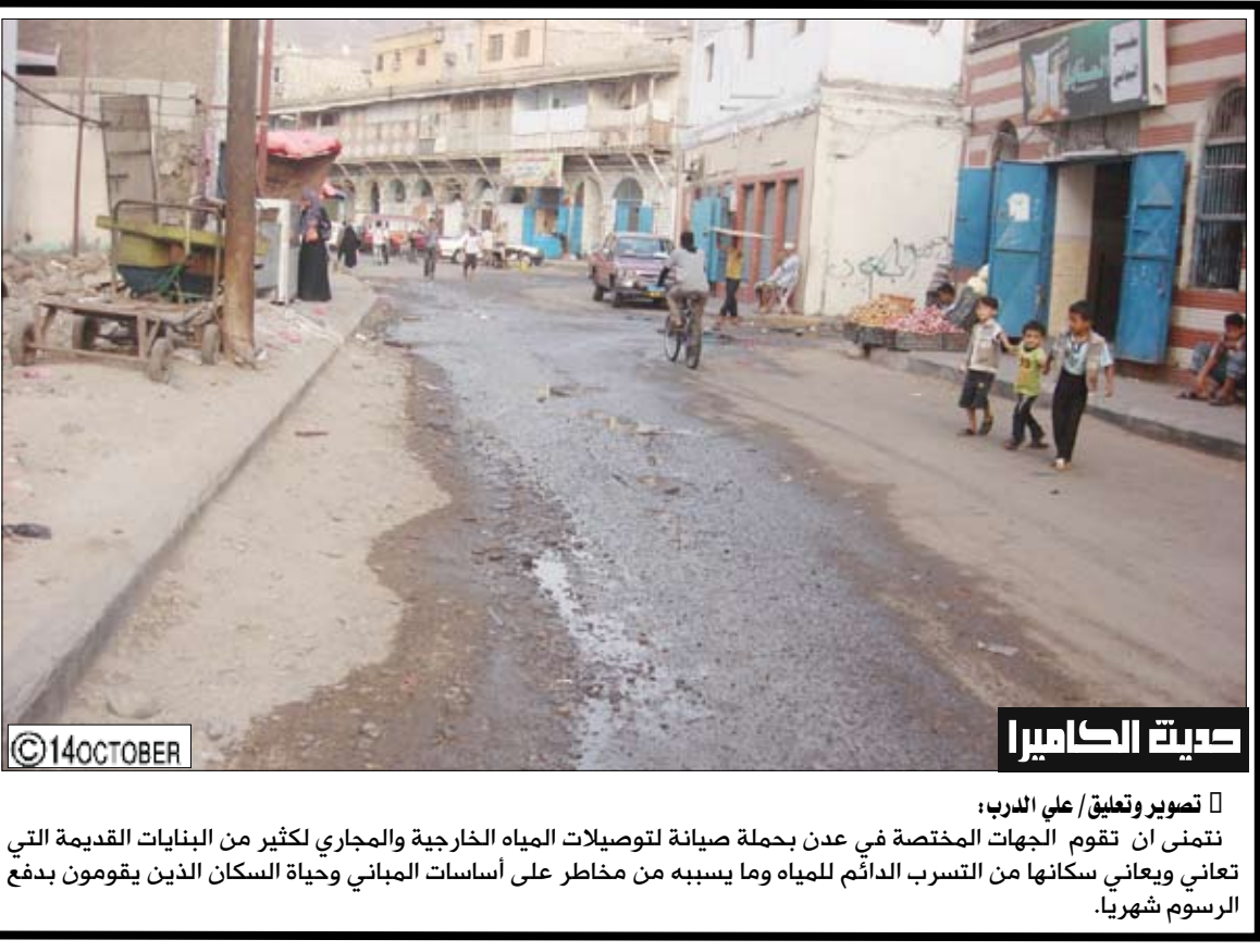
حديقة الكاميرا نتمنى أن تقوم الجهات المختصة في عدن بحملة صيانة لتوصيلات المياه الخارجية والمجاري لكثير من البنايات القديمة التي تعاني ويعاني سكانها من التسرب الدائم للمياه وما يسببه من مخاطر على أساسات المباني وحياة السكان الذين يقومون بدفع الرسوم شهريا.