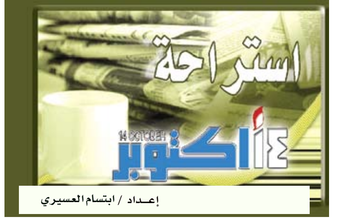
إعداد / ابتسام العسيري

لندن / منوعات: قال علماء من بريطانيا إن الشعيرات الدقيقة الموجودة على جلد الإنسان تحميه من العديد من الطفيليات مثل حشرة بق الفراش. وقال الباحثون في دراستهم التي نشرت نتائجها في مجلة «بايولوجي لبترس» البريطانية إنه كلما طال هذا الشعر كان من الأصعب على الحشرات المتطفلة أن تعتز على موضع لدغ الإنسان منه وكلما احتاجت فترة أطول في البحث عن هذا الموضع كانت الفرصة أكبر أمام الإنسان لاكتشاف هذه الحشرة. ويبدو الإنسان مقارنة بالقرود على سبيل المثال وكأنه ليس به شعر أصلا ولكن جسمه مغطى