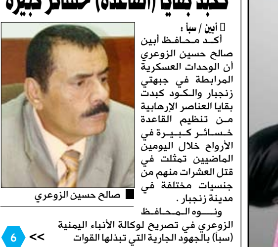
صالح حسين الزوعري

أب / سبأ : أكد محافظ أبين صالح حسين الزوعري أن الوحدات العسكرية المرابطة في جبهتي زنجبار والكود كبدت بقايا العناصر الإرهابية من تنظيم القاعدة خسائر كبيرة في الأرواح خلال اليومين الماضيين تمثلت في قتل العشرات منهم من جنسيات مختلفة في مدينة زنجبار . ونسوه المحافظ الزوعري في تصريح لوكالة الأنباء اليمنية (سبأ) بالجهود الجارية التي تبذلها القوات