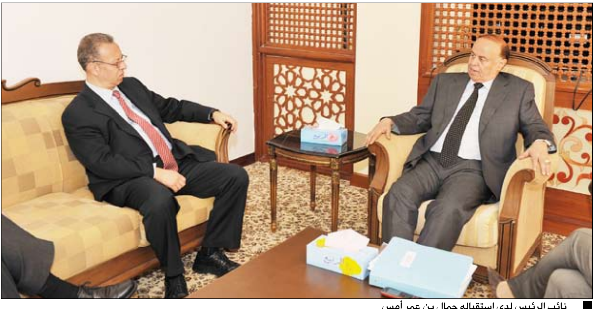
نائب الرئيس لدى استقباله جمال بن عمر أمس

صنعاء / سبأ : استقبل الأخ عبدربه منصور هادي نائب رئيس الجمهورية ظهر أمس المستشار السياسي للأمين العام للأمم المتحدة جمال بن عمر ومع وفد الأمم المتحدة إلى اليمن للمساعدة على الاستعدادات للانتخابات الرئاسية المبكرة التي ستجرى في 21 فبراير القادم. وفي اللقاء أعرب الأخ نائب رئيس الجمهورية عن سروره بالزيارة الجديدة لجمال بن عمر .. مستعرضاً جملة من الإجراءات العملية في طريق تنفيذ المبادرة الخليجية وأليتها التنفيذية المزممة .. مشيراً إلى أن تلك الخطوات العملية التي تمثلت بالدعوة إلى الانتخابات المبكرة تلقتها تكليف محمد سالم باسندوة بتشكيل حكومة الوفاق الوطني ثم انبثاق حكومة الوفاق الوطني. وأعرب الأخ عبدربه منصور هادي نائب رئيس الجمهورية عن أمه بالمضي قدماً صوب تحقيق الأهداف المرسومة وفقاً للآلية الزمنية وخروج اليمن من هذه الظروف الراهنة باعتبار ذلك المخرج الوحيد من هذه الأزمة الطاحنة التي شملت آثارها مختلف فئات ومكونات الشعب اليمني كله . وتطرق الأخ نائبا رئيس الجمهورية إلى مظاهر تلك الأضرار البالغة التي عطلت مسار الحياة الطبيعية بكل صورها وأشكالها .. معبراً عن التقدير الكبير للجهود الحثيثة التي بذلها جمال بن عمر بصورة مكثت من إحراز تقدم كبير. فيما أعرب المبعوث الأممي عن سروره البالغ لما تحقق من تقدم في مسار التسوية السياسية المرتكزة على المبادرة الخليجية وأليتها التنفيذية .. مؤكداً وقوف مجلس الأمن الدولي والمجتمع الدولي قاطبة مع التسوية السياسية السلمية في اليمن على تلك الأسس. وأشاد بالجهود