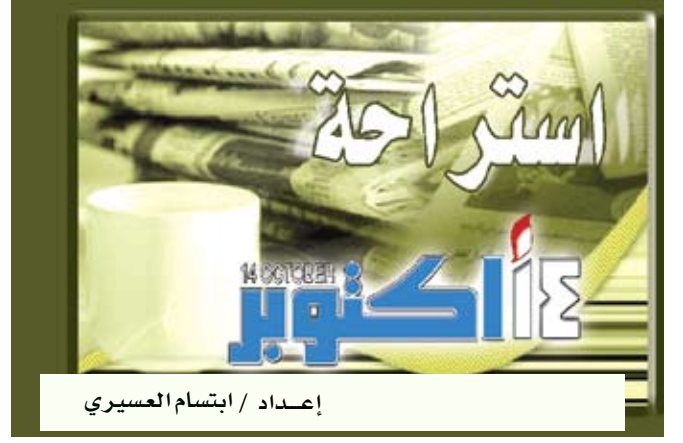
إعداد / ابتسام العسيري

وكشف المؤتمر العالمي الذي انطلق في مدينة دبي، أن عدد المصابين بالمرض وصل إلى أكثر من 366 مليون شخص على مستوى العالم، وأن الأرقام الصادرة عن