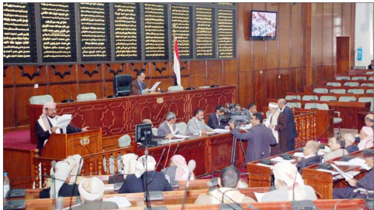
مجلس النواب في جلسته أمس