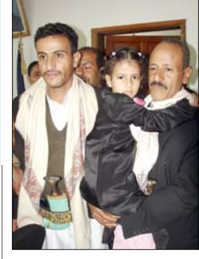
الموصومة بالخزي والعار.