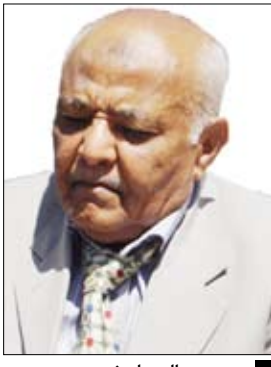
محمد سالم باسندوة

صنعاء / سيا: صدر أمس قرار رئاسي رقم (28) لسنة 2011م بتكليف الأخ محمد سالم باسندوة بتشكيل حكومة وفاق وطني فيما يلي نصه: بعد الاطلاع على دستور الجمهورية اليمنية. وعلى قرار رئيس الجمهورية رقم (24) لسنة 2011م بشأن تفويض نائب الرئيس بالصلاحيات الدستورية اللازمة لإجراء حوار مع الأطراف الموقعة على المبادرة الخليجية. وبناءً على مبادرة دول مجلس التعاون لدول الخليج العربية وأليتها التنفيذية الموقعتين في مدينة الرياض بتاريخ 23 / 11 / 2011م.