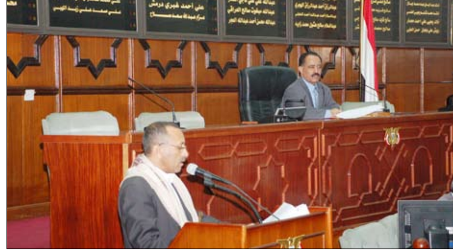
مجلس النواب في جلسته أمس

صنعاء / سيا: واصل مجلس النواب جلسات أعماله لفترة انعقاده الخامس من الدورة الثانية من دور الانعقاد السنوي الثامن أمس برئاسة رئيس المجلس يحيى علي الراعي. وأقر المجلس مشروع قانون الموانئ البحرية بصيغته النهائية، كما أقر تقرير لجنة التربية والتعليم حول التقارير الدورية للجهاز المركزي للرقابة والمحاسبة بما تضمنه من استنتاجات وتوصيات التزم بها الجانب الحكومي ممثلاً بوزير التربية والتعليم عبد السلام محمد الجوفي، وأكد من خلالها المجلس على إلزام الحكومة بتقديم تعديل لقانون الجهاز المركزي للرقابة والمحاسبة لأن القانون النافذ أصبح غير مواكب للمرحلة الراهنة، ولا يحسم المخالفات ولا يمنع تكرارها، وأن تتضمن التعديلات ضوابط لعدم التسرع في توقيف وإحالة المتهمين بارتكاب المخالفات إلا بعد التأكد من ارتكابهم المخالفات وتحديد رد