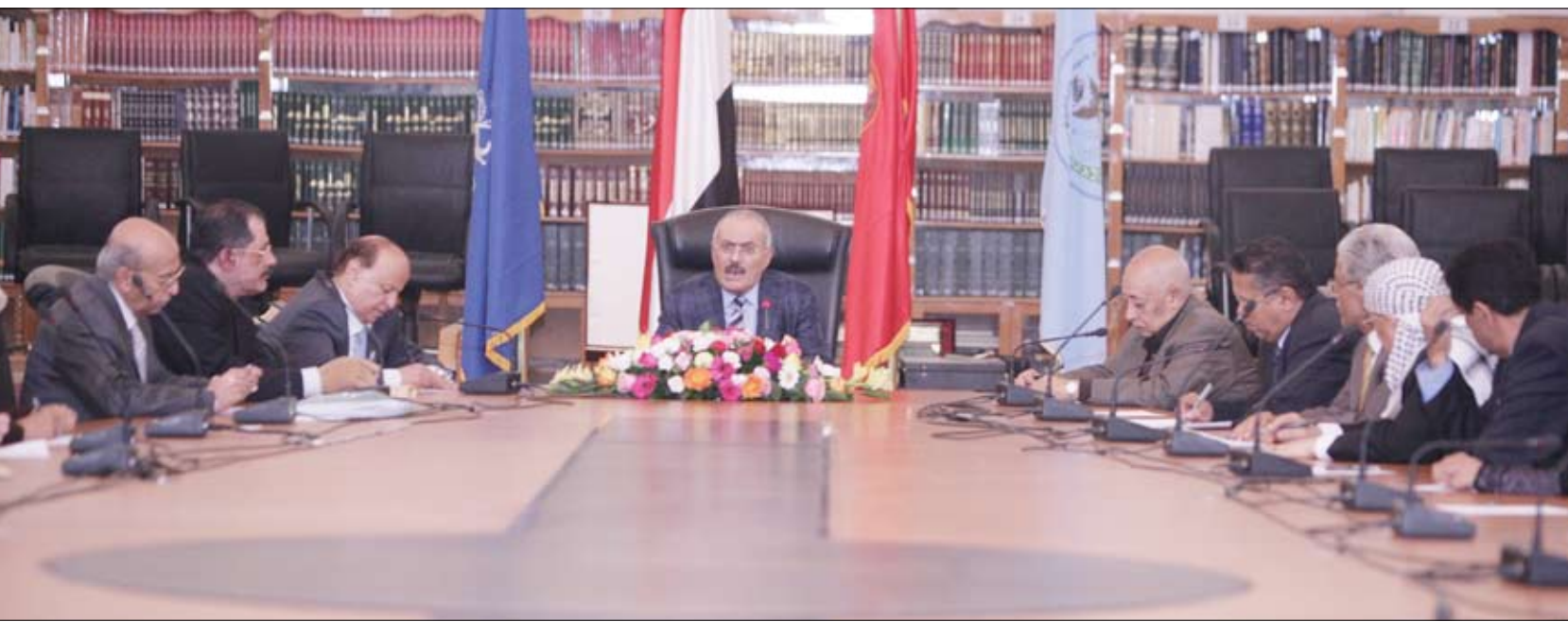
رئيس الجمهورية يرأس الاجتماع المشترك للجنة العامة للمؤتمر وقيادات أحزاب التحالف الوطني أمس

صنعاء / سيا: رأس فخامة الأخ الرئيس علي عبدالله صالح رئيس الجمهورية رئيس المؤتمر الشعبي العام ومعه الأخ عبدربه منصور هادي نائب رئيس الجمهورية النائب الأول لرئيس المؤتمر الشعبي العام الأمين العام للمؤتمر أمس اجتماعاً مشتركاً للجنة العامة للمؤتمر الشعبي العام وقيادات أحزاب التحالف الوطني الديمقراطي. وجرى خلال الاجتماع استعراض ومناقشة عدد من القضايا والمستجدات الراهنة في ضوء التوقيع على المبادرة الخليجية وأليتها التنفيذية المزمعة لحل الأزمة السياسية في بلادنا الذي تم في العاصمة السعودية الرياض. وفي الاجتماع دعا فخامة الأخ الرئيس كافة أعضاء المؤتمر الشعبي العام بجميع قواعده وأنصاره وأعضاء وقواعد أحزاب التحالف الوطني الديمقراطي وكل الشخصيات الوطنية المستقلة والشباب إلى الاصطفاف والتكاتف في مواجهة كل أعداء الوطن ووحده وأمنه واستقراره .. والدفاع عن الثوابت الوطنية وفي مقدمتها الحرية والديمقراطية والنظام وقد أعلن فخامة الأخ الرئيس العفو العام عن كل من ارتكب حماقات خلال الأزمة ما عدا المتورطين في جرائم جنائية وفي حادثة تفجير مسجد دار الرئاسة فسيحالون إلى العدالة سواء كانوا جماعات أو أفراداً. وأضاف فخامته " أنا اعتبر أن التوقيع في الرياض انتصار للشعب اليمني ولأغلب فيه ولا مغلوب، انتصار للشعب اليمني وإرادته الحرة فلا أحد يمني نفسه أن فلاناً انهزم وفلاناً انتصر هذا غير وارد ويكون مغفلاً، وعنده مرض نفسي من يتحدث حول هذا الأمر، والجانب الإعلامي يجب أن يتجه نحو التهئة من كل الأطراف سواء من الجانب الحكومي أو الجانب الحزبي الحزب الحاكم وحلفائه وكذلك ما يسمى بأحزاب اللقاء المشترك". ( التفاصيل من 3 )