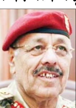
علي محسن الأحمر

تعز / سبأ: أكد مصدر أمني في محافظة تعز أن عناصر من المليشيات المسلحة التابعة لحزب الإصلاح (الإخوان المسلمين) والمنشق علي محسن الأحمر مستمرة في ارتكاب جرائمها واعتداءاتها على المواطنين وأفراد القوات المسلحة والأمن والمرافق والمنشآت العامة والخاصة. وأوضح المصدر أن تلك العناصر قامت أمس بإطلاق النار على المواطن مصطفى محمد العريفي في شارع جمال عند جولة العواضي بمدينة تعز ما أدى إلى استشهاده بعد