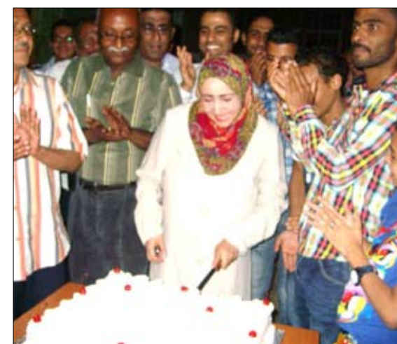
من الحفل التكريمي