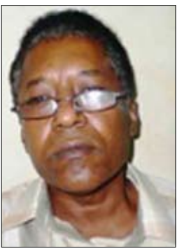
عبد السلام عامر