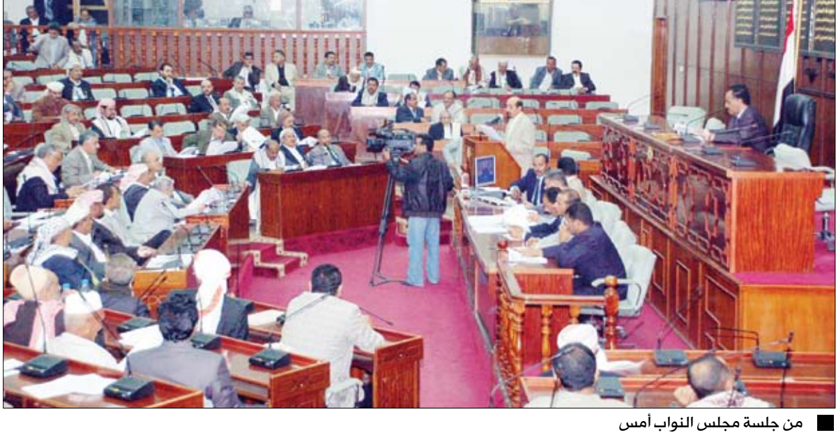
من جلسة مجلس النواب أمس

عدن/ سبأ: وافصل مجلس النواب أمس عقد جلساته لفترة انعقاده الرابعة من الدورة الثانية لدور الانعقاد السنوي الثامن برئاسة رئيس المجلس يحيى علي الراعي. واستمع المجلس إلى تقرير لجنة النقل والاتصالات بشأن مشروع قانون الموانئ البحرية، الذي يتكون من (39) مادة موزعة على أحد عشر فصلا تناولت التسمية والتعاريف والأهداف والسريان وإنشاء وتطوير الموانئ