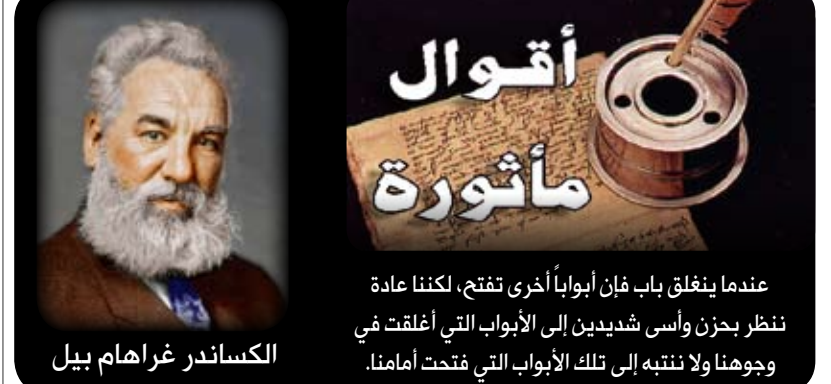
الكساندر غراهام بيل

عندما ينغلق باب فإن أبواباً أخرى تفتح، لكننا عادة ننظر بحزن وأسى شديدين إلى الأبواب التي أغلقت في وجوهنا ولا ننتبه إلى تلك الأبواب التي فتحت أمامنا.