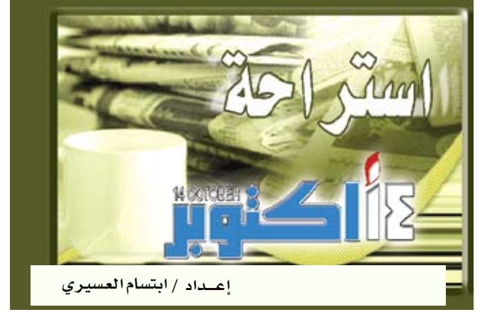
إعداد / ابتسام العسيري

تذنب / منوعات : تشهد حاستا الشم والسمع عند الأم زيادة في القوة عند تحرك غريزة الأمومة لديها للاستجابة لنداء أولادها عندما يكونون منزعجين أو في محنة. وأفادت صحيفة «دايلي مايل» البريطانية أن دراسة جديدة أظهرت أن حاستي الشم والسمع عند الأم تتأثر أن عندما تعرف أن أولادها بمحنة. وراقب العلماء من الجامعة العبرية في القدس كيف تساهم التغيرات التي تطرأ على أدمغة النساء خلال الحمل في تطوير غريزة الأمومة لديهن، وميلهن إلى بذل المستحيل لحماية صغارهن. وتبين أن حاستي الشم والسمع تتغيران في الدماغ، ما اعتبروه طريقة طبيعية لضمان قدرة الأم على رعاية أولادها.