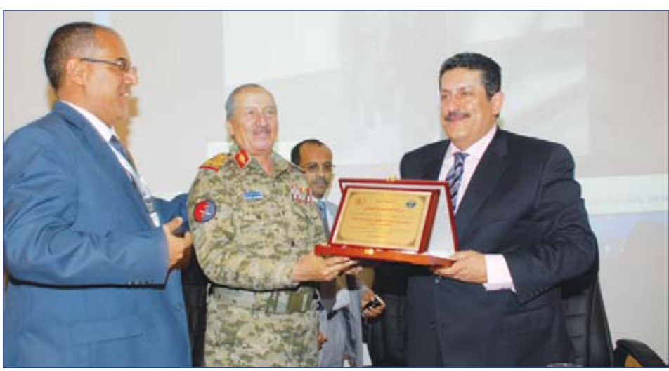
على أرض الواقع ذلك الأداء المطلوب كما ونوعاً وزمناً بما يكفل عدم استنزاف القدرات والطاقات والاستخدام الأمثل للمعطيات المتاحة ليكن لنا ذلك الدور الفعال بما يخدم تطور ورقي مخرجات الرعاية الصحية في