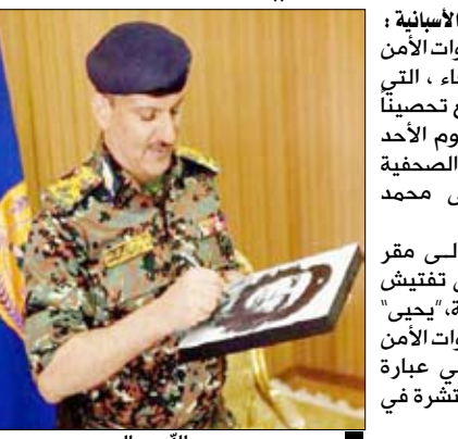
يحيى محمد عبد الله صالح

ترجمة عن (البلاد) الأسبانية : في مقر قيادة قوات الأمن المركزي في صنعاء ، التي تعتبر أقوى المواقع تحصيناً في اليمن، وفي يوم الأحد كان موعد المقابلة الصحفية مع العميد يحيى محمد عبدالله صالح. أثناء دخولنا إلى مقر القائد لم يتم حتى تفتيش محتوياتنا الشخصية، يحيى هو رئيس أركان قوات الأمن المركزي والتي هي عبارة عن قوات أمنية منتشرة في كل البلاد. ويعتبر "يحيى" من أكبر القيادات الأمنية في اليمن ويتمتع بنفوذ واسع على المستوى السياسي. كان الأمن مستقراً حتى شهر مارس حين قرر قائد الفرقة الأولى مدرع دعمه وتأييده للثورة الشعبية ضد الرئيس