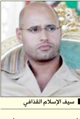
سيف الإسلام القذافي

طرابلس / متابعة : قال سيف الإسلام القذافي رسالة له إنه لن يقبل التعازي في والده وأخوته حتى تبتسم والدته وصغية وترغرد أخته عائشة وتوعد بنهر من الدم ، وأوضح إن الناتو لن يستطيع حماية من وصفهم بمغلاء الناتو في بيوتهم وفي سياراتهم وفي أعيادهم وأماكن عملهم ولن يقبل العزاء حتى ينتهي من مهمته ولو بعد خمسين عاماً. وأوضح سيف الإسلام القذافي في رسالة إلى وكالة سيفن دايز أمس الأول الثلاثاء " أنه يخرج عن صمته لداعي الواجب المفروض عليه تجاه عائلته وتجاه الأوفياء من الشعب الليبي، وأضاف قائلاً "أنني أطمئن عائلتي والدي وأخوتي أنني على ما يرام وأنني كما عرفوني دائماً لا يمكن أن أخون وصية والدي حيا فكيف أخون وصيته ودمه ميتاً ؟ " وتابع سيف الإسلام قائلاً "أما الأوفياء من الشعب الليبي فإني أقول لهم لو كنا نريد التراجع لتراجعتنا قبل أن ندفع لك هذا الثمن لكن الآن نحن