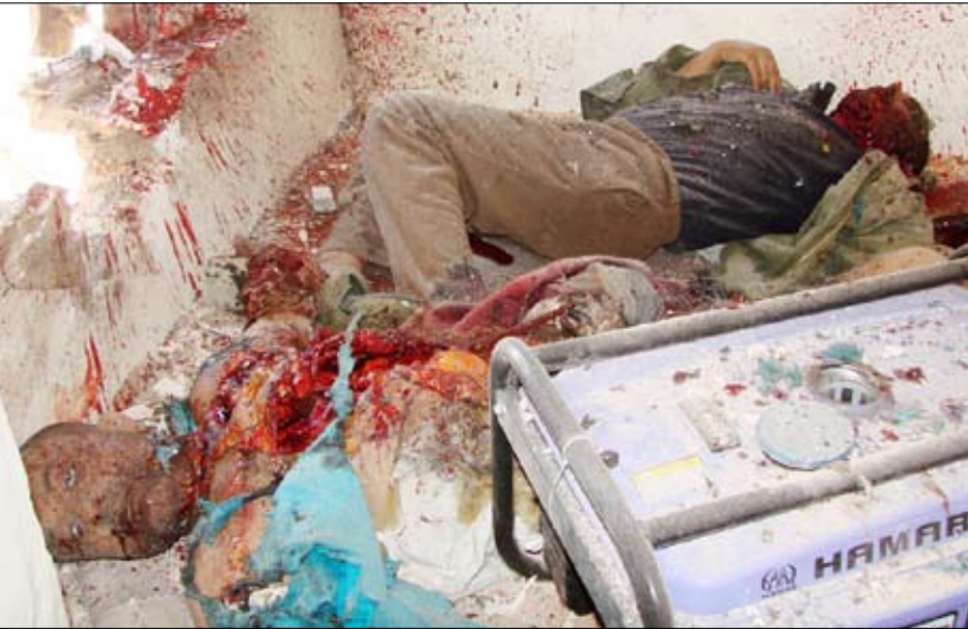
أشلاء قتيلين تعرضا للقصف بقذيفة من مليشيات المشترك والفرقة في حارة العليين بصنعاء القديمة