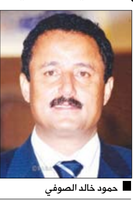
حمود خالد الصوفي

تعز / سبأ : أكد محافظ تعز حمود خالد الصوفي ضرورة إدراك المخاطر الكبيرة التي تحدد بالحالة المدنية والسلامية بمدينة تعز والمحافظة بشكل عام. وقال الصوفي خلال اجتماعه أمس بالمجلس المحلي وقيادة المؤتمر الشعبي العام وأحزاب التحالف الوطني بمحافظة "علينا تركيز الجهود لمعالجة أسباب التوتر بمدينة تعز وبالتفاهم والحوار الجاد والمسئول نحو أن نحيل الموضوع إلى الأجهزة الأمنية لاستعادة الأمن والسكينة واحترام الضوابط القانونية والدستورية وإخراج المسلحين من المدينة". وأشار إلى أهمية تفعيل دور اللجان الشعبية التوعوية بالحارات ومنع مسلحي الإخوان المسلمين والعناصر المتمردة من مهاجمة المراكز والنقاط الأمنية في حاراتهم وجوار منازلهم أو التسلل إلى أسطح المباني .. مؤكداً أن الدولة في الأخير هي المسئولة عن حفظ الأمن وأن هذه اللجان الشعبية ما هي إلا عامل مساعد في توعية الناس بالاعتصام الكبيرة التي تحدد بالجميع وضرورة التعاون في استعادة الأمن والسكينة. من جانبه أكد الأمين العام للمجلس المحلي بتعز محمد