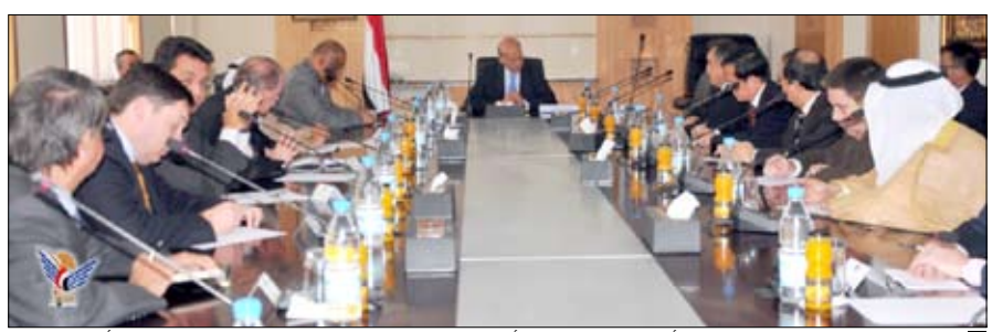
القربي لدى لقائه سفراء الدول الأعضاء في مجلس الأمن ودول مجلس التعاون الخليجي وسفير الاتحاد الأوروبي