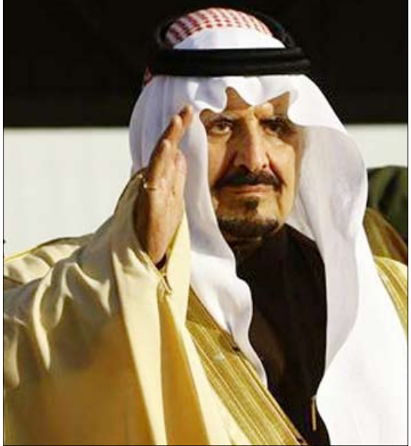
الأمير سلطان بن عبدالعزيز

سخر مصدر مسئول برئاسة الجمهورية مما تروج له قناة الجزيرة من مزاعم المتمرد علي محسن صالح الأحمر ومن معه من المنشقين والخارجين على الدستور والنظام والقانون عن التقاط مكالمات هاتفية منسوبة لفخامة الأخ رئيس الجمهورية. وقال المصدر لوكالة الأنباء اليمنية (سبأ) " إن هذه الادعاءات السيئة تثير السخرية والإشفاق على أصحابها لما وصلوا إليه من حالة هستيرية ونفسية متأزمة جعلتهم في حالة من الهذيان والهلوسة والترويج لمثل تلك الأكاذيب