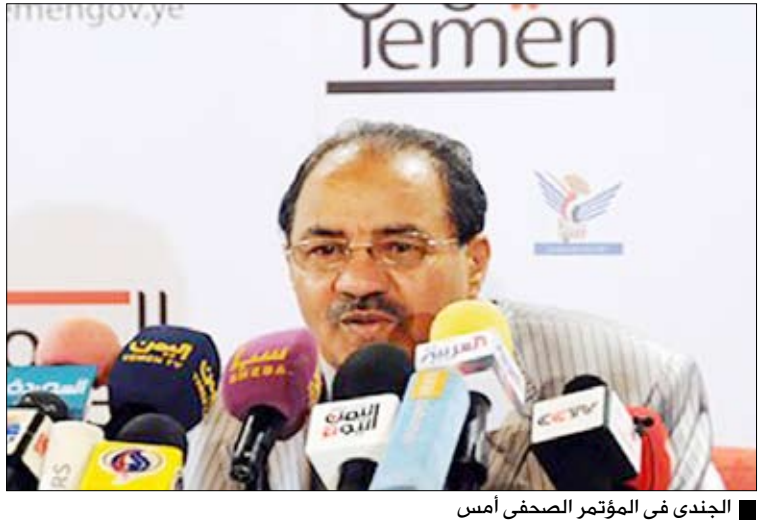
الجندي في المؤتمر الصحفي أمس