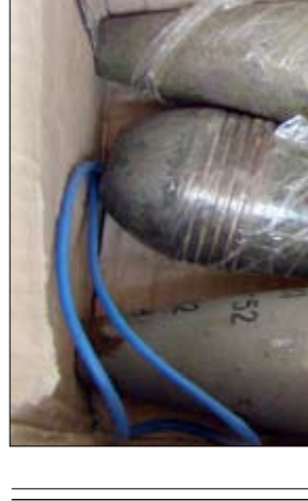
المتفجرات والعبوات الناسفة المضبوطة