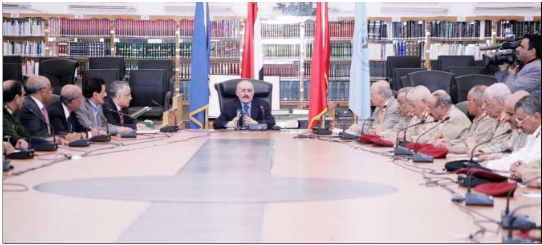
رئيس الجمهورية لدى ترؤسه اجتماع لقيادات وزارتي الدفاع والداخلية وقادة الأجهزة الأمنية أمس