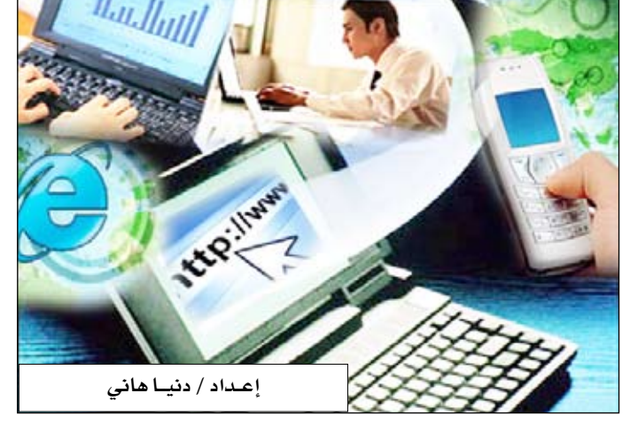
إعداد / دنيا هاني