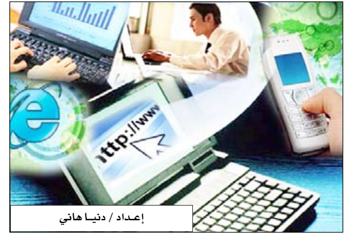
إعداد / دنيا هاني

واشنطن/منايات: ظهرت مجموعة (أونيموس) الناشطة في حرق المواقع الإلكترونية من جديد على واجهة الأحداث في الولايات المتحدة متوقعة بمحو موقع بورصة نيويورك عن الإنترنت. ونشر على موقع (يوتيوب) الأسبوع الماضي شريط مسجل ظهر فيه شخص يقول إنه ينتمي إلى مجموعة (أونيموس) وكان قد توعد بمحو موقع بورصة نيويورك عن صفحات الإنترنت في (أكتوبر) الجاري. ووفقا لما ذكرته مصادر إعلامية